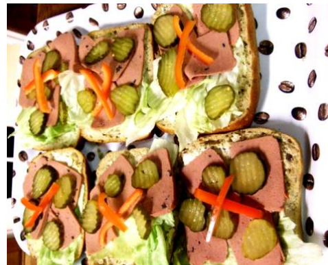
Du missar väl inte fikets unika och goda kryss-mackor.