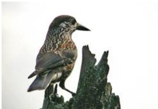
Nötkråka rastande på Fornborgsberget hösten 2016.

I främst östra Norrland har den östliga smalnäbbade rasen häckat från 1970-talet.