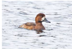
Bergand i Ravalen.

Största rapporterade antal var 7 st den 3/11.