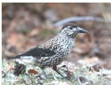
Födosökande nötkråka väster om Bögs gård hösten 2016.