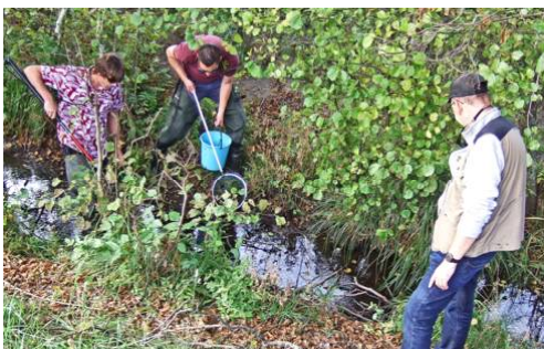
Provfiske i Igelbäcken.

Under de senaste provfiskena har det konstaterats att det numera finns signalkräfter i bäcken. Dessa är olagligt utsatta, men förutsättningarna verkar inte vara så särskilt goda till att de ska kunna växa sig stora. Signalkräftorna verkar inte heller påverka grönlingarnas förekomst i Igelbäcken i någon större grad.