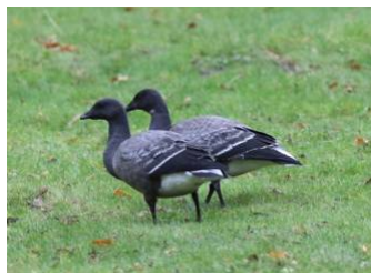
Rastande prutgäss på Golfängarna.

Arten har hittills bara setts rasta på Järvafältet vid något mycket enstaka tillfälle. Denna höst har emellertid 2 st prutgäss rastat på Golfängarna vid Lötsjön den 16-17/10 och ytterligare en vid Råstasjön den 19/10-10/11.