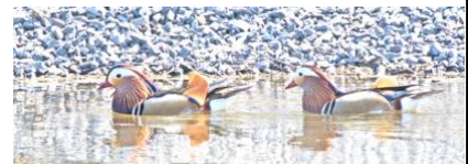
Mandarinänder i Järfälla kyrkdamm sommaren 2016.