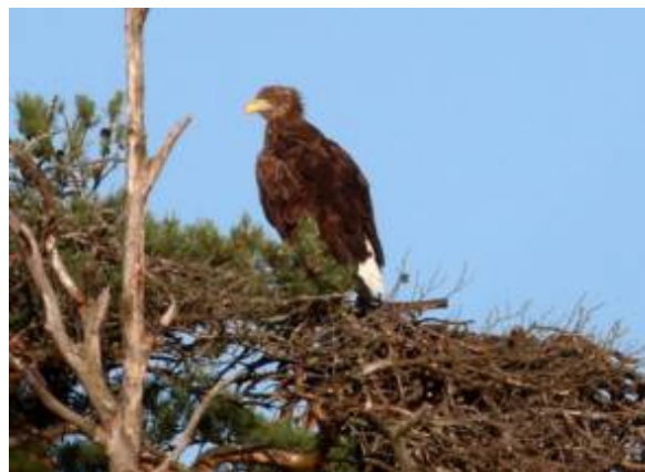
Havsörnar vid Säbysjön. Örnen t h inspekterande ett av fiskgjusarnas bon.