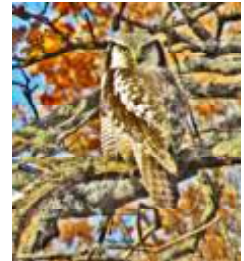
Hökuggla öster om Säbysjön.

En rastande hökuggla upptäcktes den 29/10 invid grusvägen öster om Säbysjön.