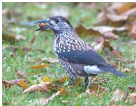
Födosökande nötkråka i Viby (nära Pizzerian).

Under vissa höstar/vintrar upplevs invasioner från öster av de ofta mycket oskygga smalnäbbade nötkråkorna i stora delar av landet inkluderat Järvafältet. De smalnäbbade har under senare år etablerat sig i landet och häckar numera årligt här. Hybridisering mellan de båda raserna blir allt vanligare, vilket försvårar möjligheten att skilja den tjocknäbbade och smalnäbbade rasen av nötkråka åt.