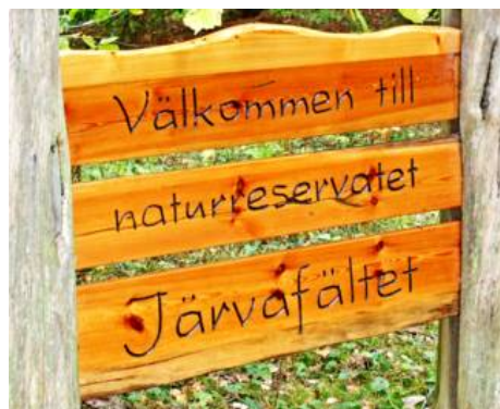
Välkomstskylt, som nog inte omfattar minkar.

Minkfällorna har åter satts ut vid Igelbäcken och JOK fortsätter att även denna vinter assistera Järfälla kommuns viltvårdare i jakten på minkar. Antalet minkar vid Säbysjön upplevs numera som mycket färre än för några decennier sedan. Men minkar finns tyvärr fortfarande kvar vid sjön.