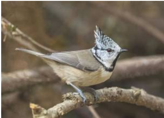
Det finns goda chanser att få se tofsmes vid JOKs skogsmatning väster om Fäboda gård.