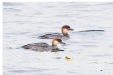
Salskrakar i Ravalen.

Därefter sågs en salskrake i sjön t o m den 15/10.