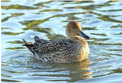
Stjärtand vid Hjulsta vattenpark.

Vid Hjulsta vattenpark sågs en stjärtand den 27-29/9.