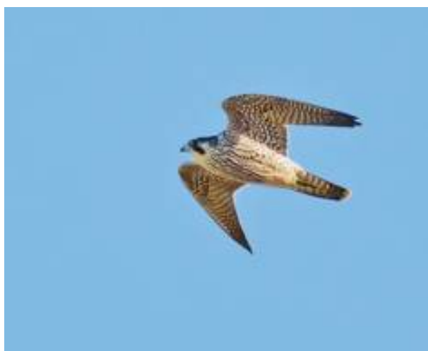
Pilgrimsfalk över 30-meterskärret.

I år sågs flera rovfågelarter än normalt på Järvafältet. Förutom ovan uppräknade arter observerades även havsörn , ormvråk , fjällvråk , kungsörn , stenfalk och pilgrimsfalk . Dessa arter observeras årligt med varierande stort antal i området.