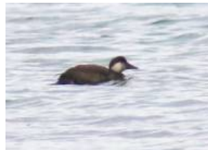
Sjörre i Ravalen.

Den 13-27/10 rastade en sjörre i Ravalen.