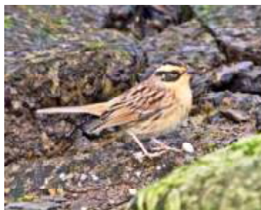
Sibirisk järnsparv, en av flera rara gäster från öster på Öland under oktober 2016.

Gustav och jag stannade på södra delen och besökte ett antal lokaler. Vid Ventlinge hade vi varfågel , mindre korsnäbb , bergfink , gransångare och svarthätta och vid Tvärvägen sträckte en flock om nio mindre sångsvanar över mot sydväst.