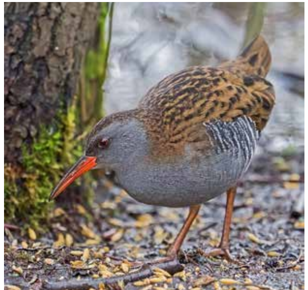
Gråhäger och Vattenrall vid Råstasjön.