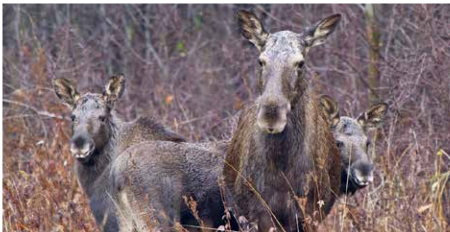
Faunapassager gör det lättare för bl a älgar att besöka Järvafältet.

Dessutom finns planer på att anlägga flera småviltspassager utefter leden.