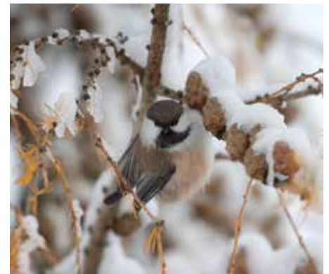
Lappmes i Uppsala.

Att få se en lappmes på en matning i vår del av landet är för övrigt ingen omöjlighet, eftersom en sådan uppehöll sig under nov-dec 2004 på en matning i Gottsunda, Uppsala. ●