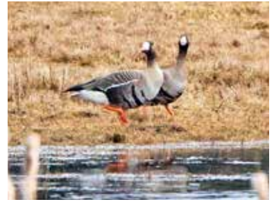
Bläsgås på Säby strandäng.

Under hösten 2016 observerades arten endast vid två tillfällen på Järvafältet, vilket givetvis upplevs som klart negativt.