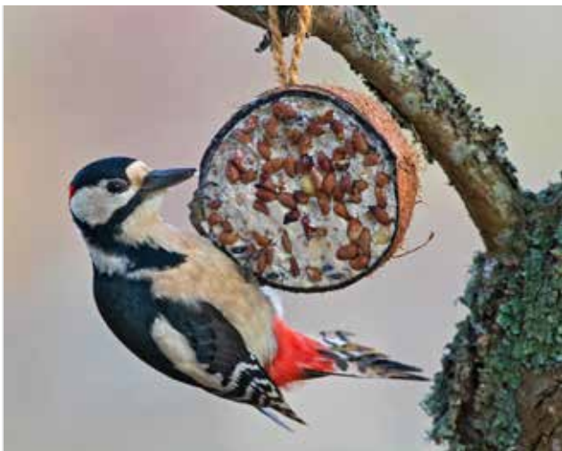
Större hackspett.