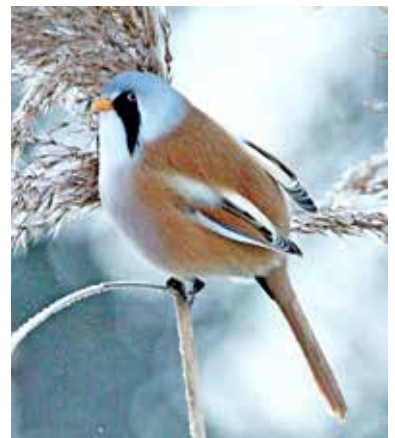
Skäggmes vid Råstasjön.