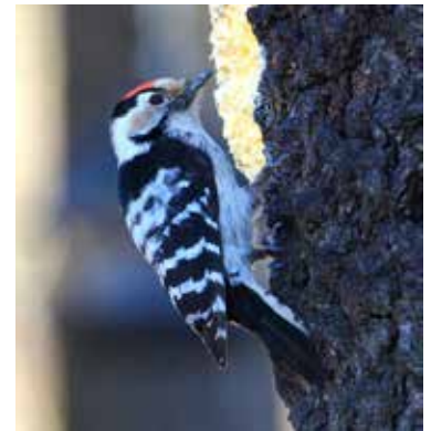
Mindre hackspett.

Ett STORT TACK till främst de som haft huvudansvaret för matningarna, men givetvis också för alla bidrag. Detta har inte bara uppskattas av övervintrande småfåglar utan också av mängder med reservatsbesökare som ivrigt skådat och ofta fotograferat fåglar vid matningarn.