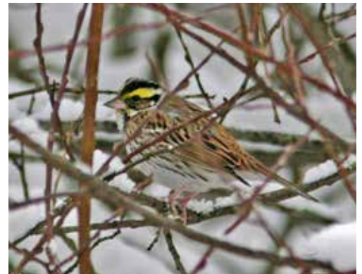
Sveriges hittills enda fynd av gulbrynad sparv.

Kolla i programmet så att du inte missar mötet med göktytan. ●