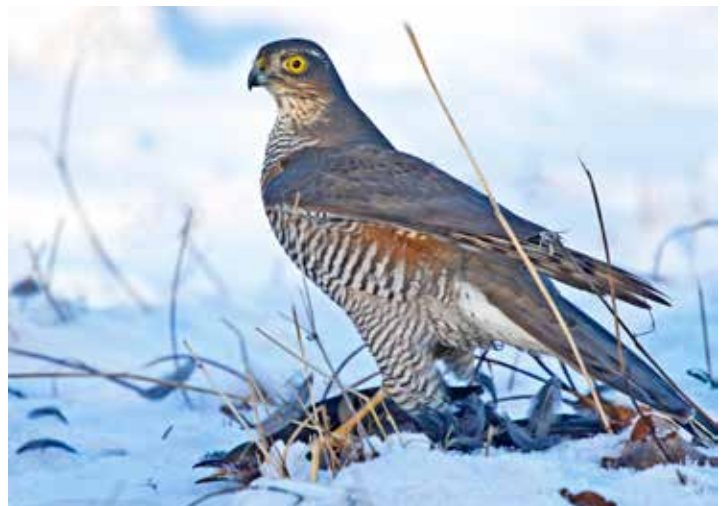
Sparvhök med slagen koltrast.