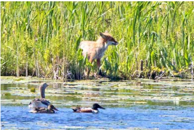
Räv spanade ut mot nåsöarna.

Under den gångna vintern fångades två minkar i de fällor som satts ut i vid Igelbäckens i 30-meterskärret. Vintern 2014-15 fångades ingen mink.