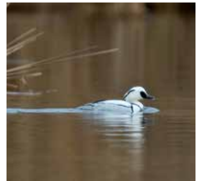
Salskrake i Ravalen.