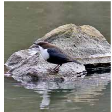
Strömstare vid Igelbäcken.