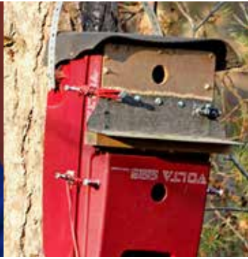
Kajsa Vargs fägelholk.