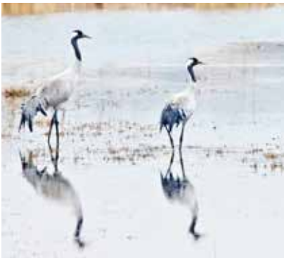
Tranpar på Säby strandäng.

Inleder denna sida i stark positiv stil och detta framför allt på grund att Råstasjön räddats, en stor seger för alla naturälskare. Den populära fågelsjön, med tillhörande biologisk mångfald, utgör en pärla som kommer att värderas allt högre i takt med storstadens växande.