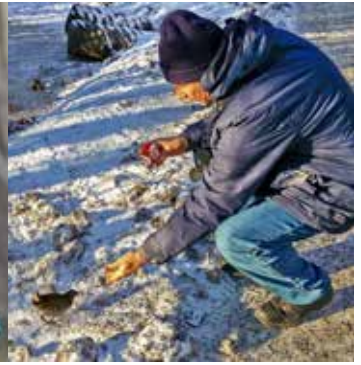
Hasse I matar vattenrall.