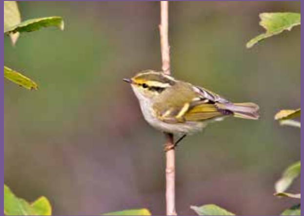
Kungsfågelsångare söder om Torngård.