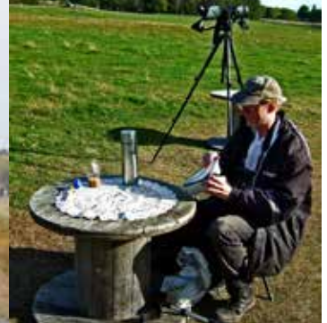
Johan har höjt standarden.