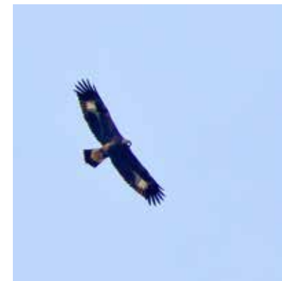
Kungsörn (1K) över 30-meterskärret.