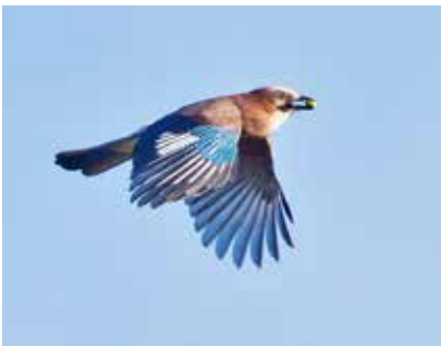
Nötskrika, en av höstens karaktärsfåglar på Järvafältet.

Det har bara gått ca två månader sedan föregående nummer av JOK-bladet presenterades, men trots den relativt korta tidsperioden, har det ändå hunnit hända lite på vårt Järvafält att fylla bladet med.