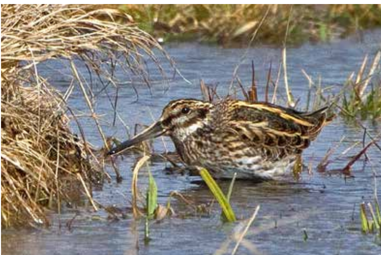
Vi hoppas på dvärgbeckasin i 30-meters även nästa år, trots höstens giftutsläpp.