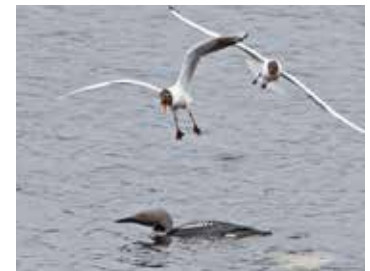
Storlom och skrattnäsa.