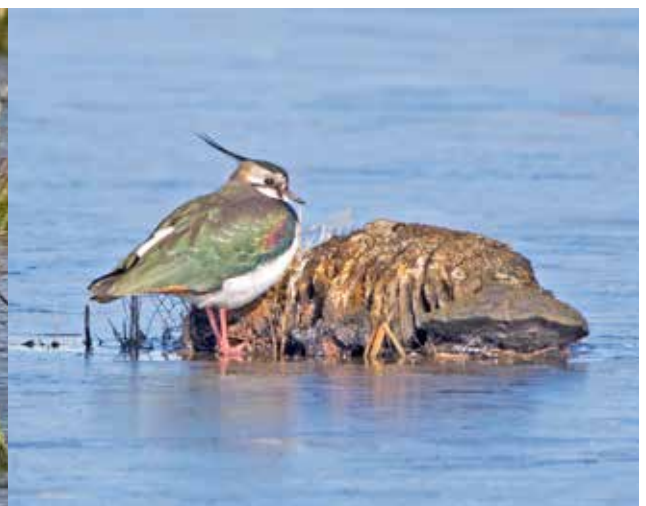
Tofsvipa numera internationellt hotad p g a brist på strandängar.