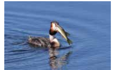
Skäggdopping med gädda.