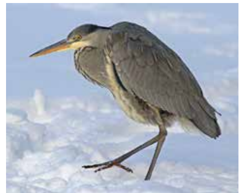
Gråhäger övervintrar i stort antal vid Råstasjön.