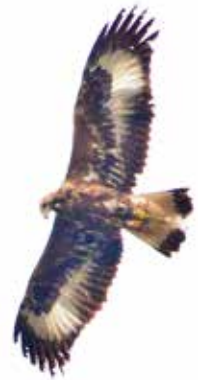
Kungsörn (2K) över 30-meterskärret.