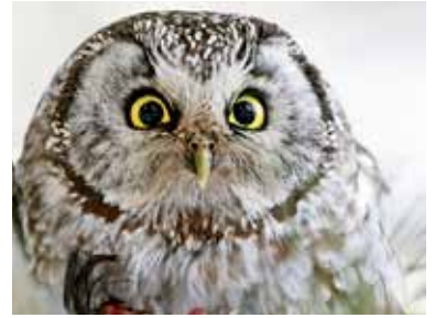
Pärluggla i Jakobsberg 2010.

En förbiflygande ortolansparv observerades vid 30-meterskärret den 26/8.