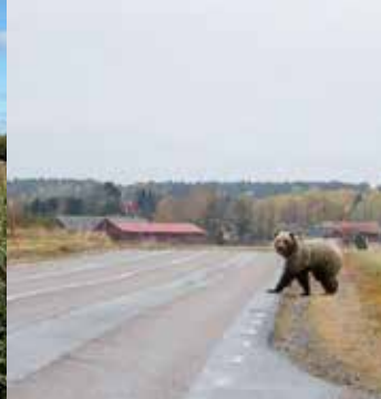
Tungt tomtkruss.