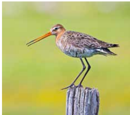
Rödspov på Öland.