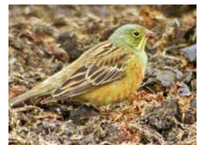
Ortolansparv vid Säby gård 2005.