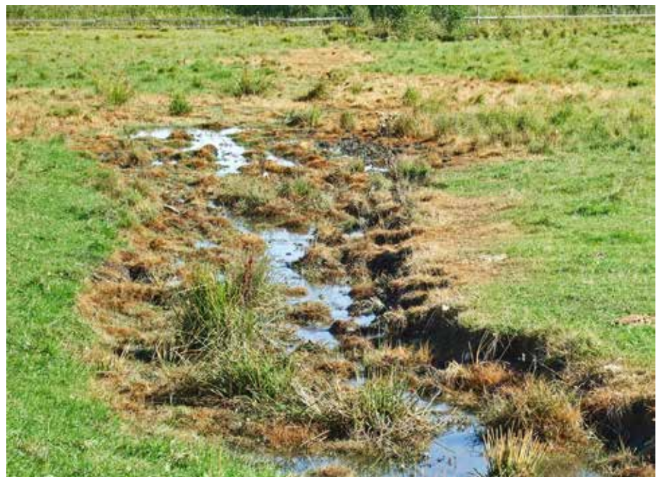
Giftskadat dike i 30-meterskärret.

JOK kommer givetvis att i samarbete med Järfällas kommunekolog hålla koll på helikoptrarna.