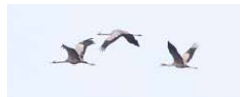
Tranfamiljen över 30-meterskärret.

Under flera år har minst ett tranpar uppehållit sig på norra Järvafältet under häckningstid och i år fick vi äntligen uppleva artens första häckning i vårt område. Områdets första tranhäckning redovisades i föregående JOK-blad och därför