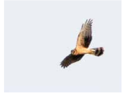
Hybrid stäpphök x blå kärrhök sträckande över 30-meterskärret.

Den 4/9 upptäcktes från 30-meterskärrets obsplats en sträckande ung kärrhök.