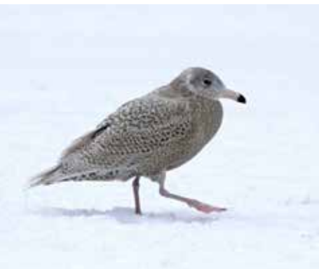
Bland de rariteter som observerats vid Råstasjön finns vittrut.

Alfågel (2008) Sjööorre (2012) Vittrut (2010) Slaguggla (2011-12) Härfågel (1984) Kungsfiskare (2015)