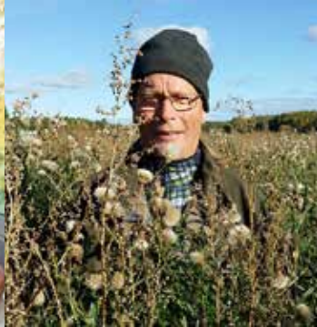
Bosse mitt i "spenaten".