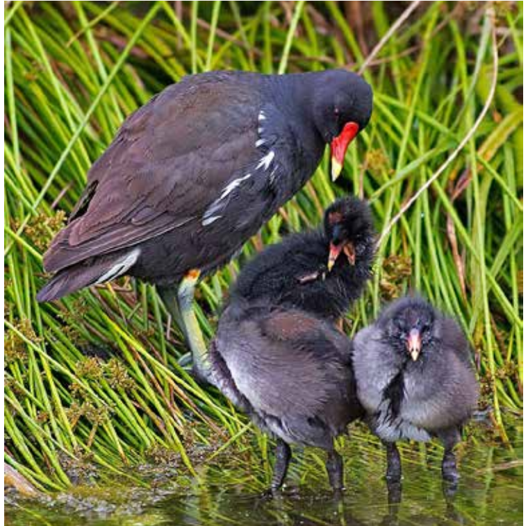
Rörhöna med ungar.