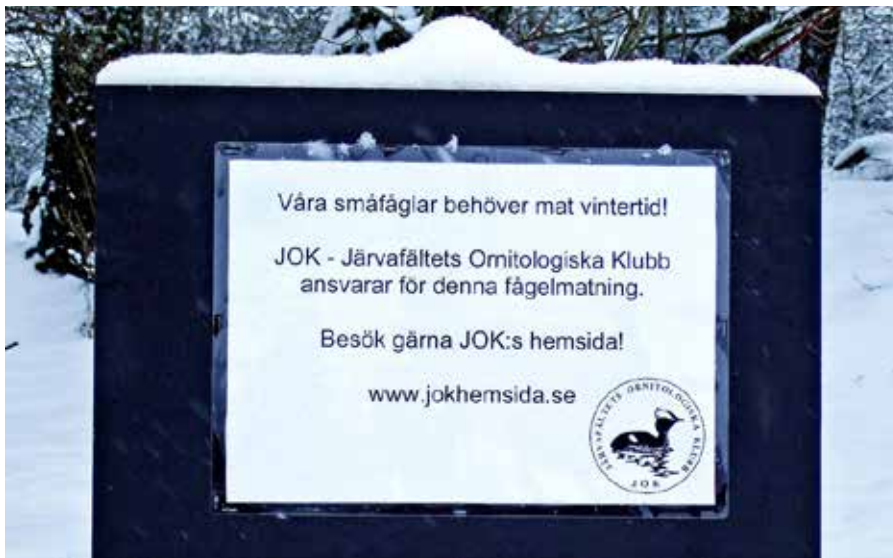
Skylt vid JOKs fågelmatningar.