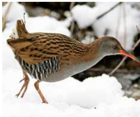
Råstasjön utgör landets bästa lokal för att få se vattenrall.