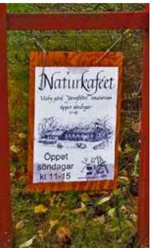
Kafés skylt.

Definitiva datum för JOKs kafésöndagar presenteras så småningom på JOKs hemsida (Anslagstavlan).