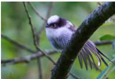
Mycket ung stjärtmes.