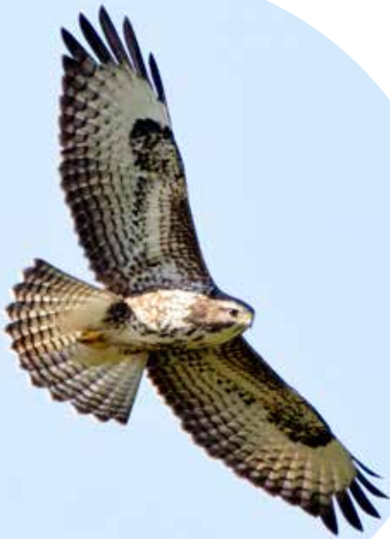
Ormvråkarna var trevligt många hösten 2015.

Antalet sträckande pilgrimsfalkar blev totalt 10 st, vilket utgör en tangering av det näst högsta antal som noterats under höststräcket. Allra flest pilgrimsfalkar observerades under hösten 2005, då 18 st sträckte över norra Järvafältet. ●