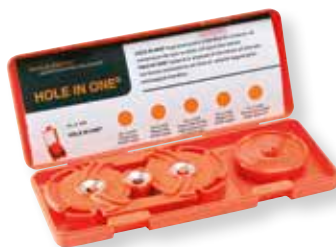
Tuoteno 2004F Sarja kaksoisrasialle, sisältää osat: