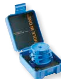
Art. nr. 800NXL+ Suomi HOLE IN ONE® -sarja, sisältää osat: