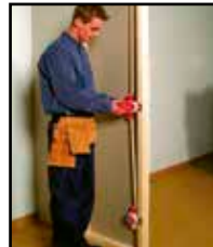
Aseta HOLE IN ONE -sisäke sähkörasiaan.