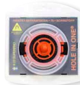
Tuotenro 8.22SP HOLE IN ONE® SuperPro

Hole-In-One SuperPro -magneettihakujärjestelmämme sisältää huipputehokkaan neodyymimagneetin ja helpottaa kaikenlaisien levyjen ja paneelien asennusta sähkörasioiden päälle. Hole in one Super Pro haastavampiin tehtäviin. HUOM! alkuperäinen soveltuu täydellisesti normaaliin käyttöön.