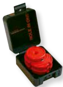
Tuoteno 2005F Sarja kojerasialle 1 1/2 sisältää osat: