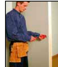
Poista sisäke ja työvaihe on valmis.