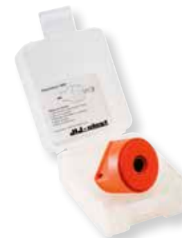
Tuoteno 2000F Superilmainen merkintäleimasimella