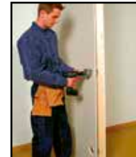
Tee reikä reikäporalla pitäen poraa etäällä rasiasta.