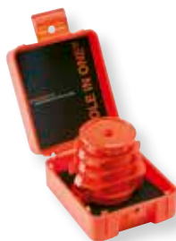
Tuoteno 800FXL+ Suomi HOLE IN ONE® -sarja, sisältää osat: