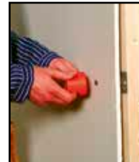
Etsi sisäke HOLE IN ONE 8:21F -ilmaisimella tai 2000F Super -ilmaisimella ja merkitse keskustan paikka.