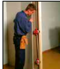
Aseta kipsilevy tai paneeli paikalleen.