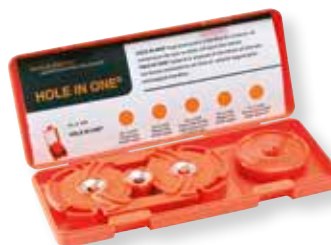
Art. nr. 2004 Sats för dubbeldosa Innehåller: