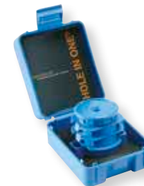
Art. nr. 800NXL+ Norsk HOLE IN ONE® Satsen innehåller: