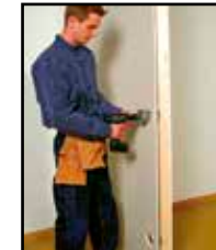
Tee reikä reikäporalla pitäen poraa etäällä rasiasta.