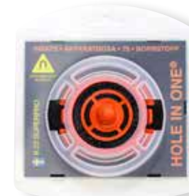
Tuotenro 8.22SP HOLE IN ONE® SuperPro

Hole-In-One SuperPro -magneettihakujärjestelmämme sisältää huippuvoimakkaan neodyymimagneetin ja helpottaa kaikenlaisien levyjen ja paneelien asennusta sähkörasioiden päälle. Hole in one Super Pro haastavampiin tehtäviin. HUOM! alkuperäinen soveltuu täydellisesti normaaliin käyttöön.