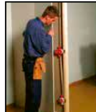
Aseta kipsilevy tai paneeli paikalleen.