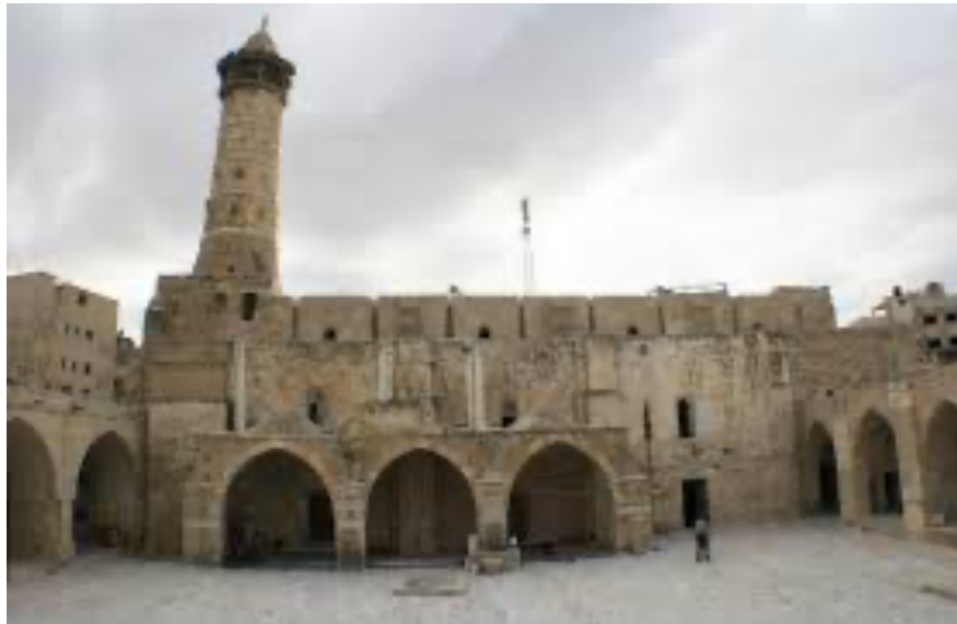
مسجد عمری در غزه که یکی از مساجد قدیمی این شهر است.

فلسطین کشوری پهناور و دارای خوبی های فراوان است. که غزه از شهرهای آن در دوره های اسلامی تحت نظارت مالی و اداری حکومت های آن دوران اداره می شد. و در منابع تاریخی مورد پیشینه تاریخی غزه می گویند که این شهر را یونانی ها بنا کرده اند و درختان زیتون را آن در آن جا برای نخستین بار کاشته اند.