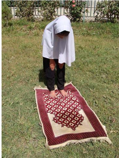
* په سجده کې ورنونه او متبې (بازو) په څنگونو (بغل) نښلوي او څنگل (آرنج) او لیچې (ساعد) په ځمکه نښلوي او پښې ځملوي چې د پښو گوتې یې سره نښلي.