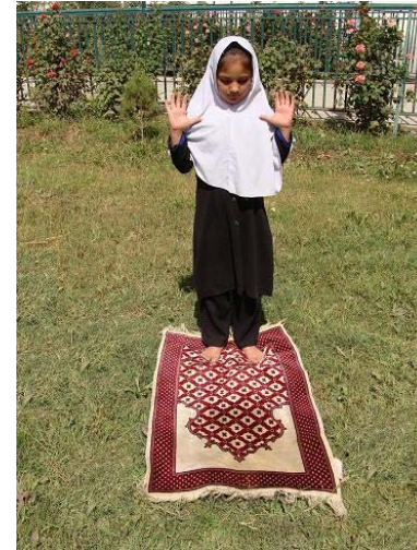
* د فاتحې او بلې سورې د ویلو په وخت کې لاسونه په ټټر (سینه) اړېږدي.