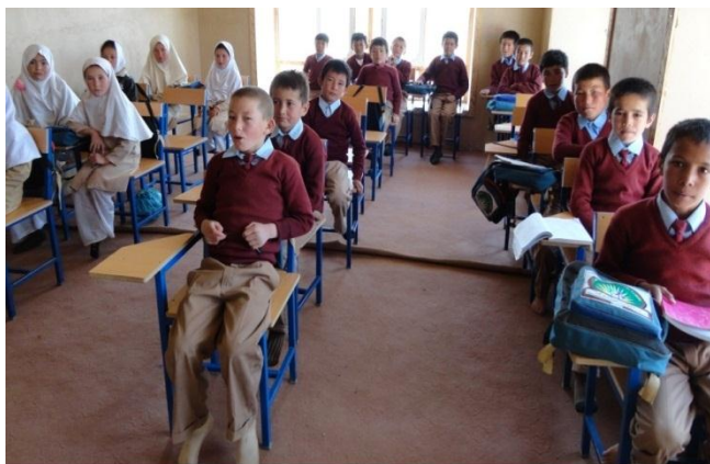
تصویر از یک صنف درسی (صنف 4)

از ایجاد لیسه رهنورد نور در مرکز ولسوالی لعل و سرجنگل دوسال بیشتر نمیگذرد، اما شهرت و معرفت بیشتر از دو سال دارد، با امکانات معیاری تعلیم و تربیه تجهیز شده است، صنوف مجهز، مواد و مدد درسی لازم، مورد استفاده قرار گرفته است، اساتید مسلکی که حد اقل فارغ تربیه معلم است به خدمت گماشته شده است. بر علاوه نصاب تعلیمی معارف کشور، انگلیسی از صنف چهار و کمپیوتر از صنف شش به شکل اساسی تدریس میگردد. مطابق به پلان تعلیمی و تربیتی از قبل طرح شده مدیریت لیسه، ارزیابی ماهوار، تدویر جلسه والدین در آخر هر ماه، ارتباط یومیه اداره مکتب با والدین شاگردان بخاطر جلوگیری از غیر حاضری و انجام وظیفه