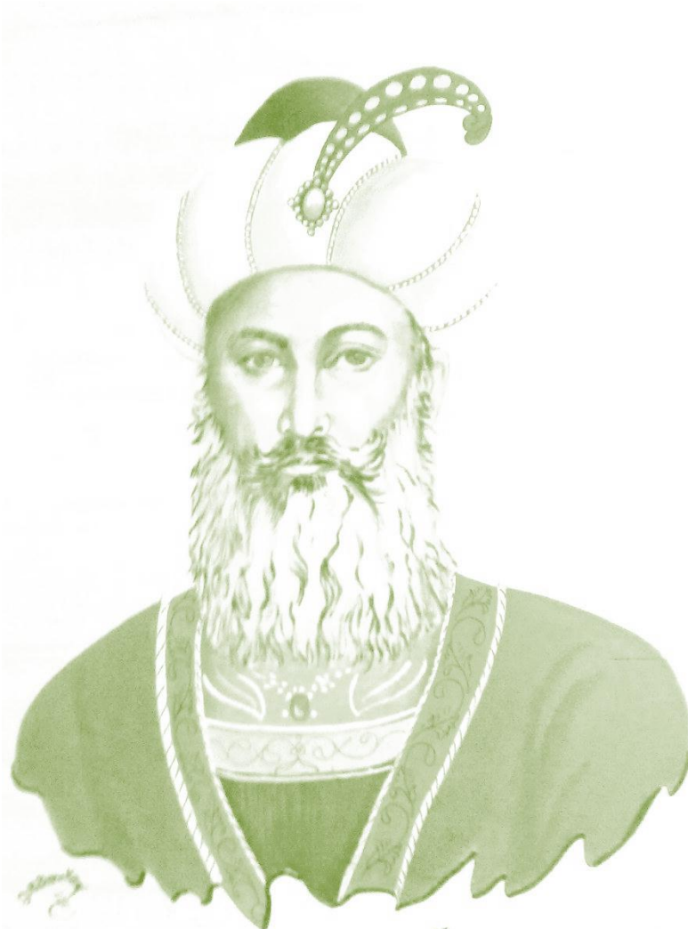
امپراتور بزرگ سلطان غیاث الدین غوری Sultan gheiyase aldin ghori

غور ای مهد جوانمردان حق غور ای کاشانه گردان حق غور ای سر منزل خاصان حق غور ای سر دفتر پاکان حق غور ای شهر شهی بسطام غور غور ای منظومه اجرام نور غور ای آن سر زمین پر غرور شیر مردان وجوانان غور غور ای کاغوش مردان بزرگ خطه و مرز دلیران سترگ خانه آزاد مردان جهان سنگر آن راد مردان زمان بود عم آن سپهسالار ما شاه علاءالدین حسین سردار ما هم حکیم و هم شجاع و هم دلیر روز هیجا میکند شیران اسیر شاه معزالدین تالدنیا که هست و آن شهاب الدین نخبه از الست هندو وسند و غور و غزنه و هرات از سمرقند تا به دجله و فرات ظل چتر امپراطوری بود کهکشانشان دولت سوری بود