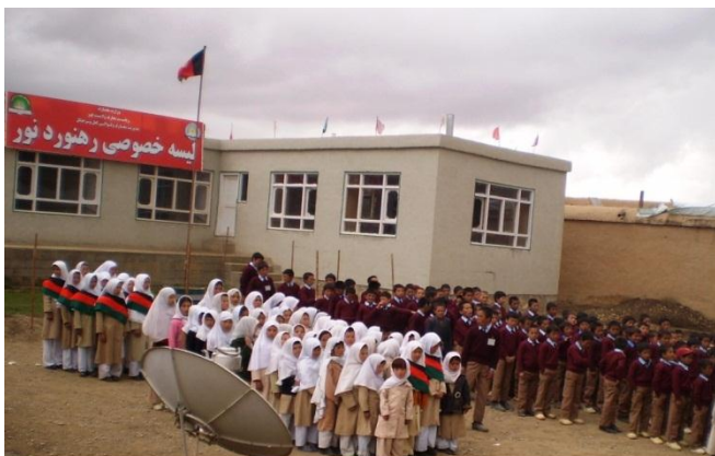
تصویر از شاگردان روی محوطه مکتب