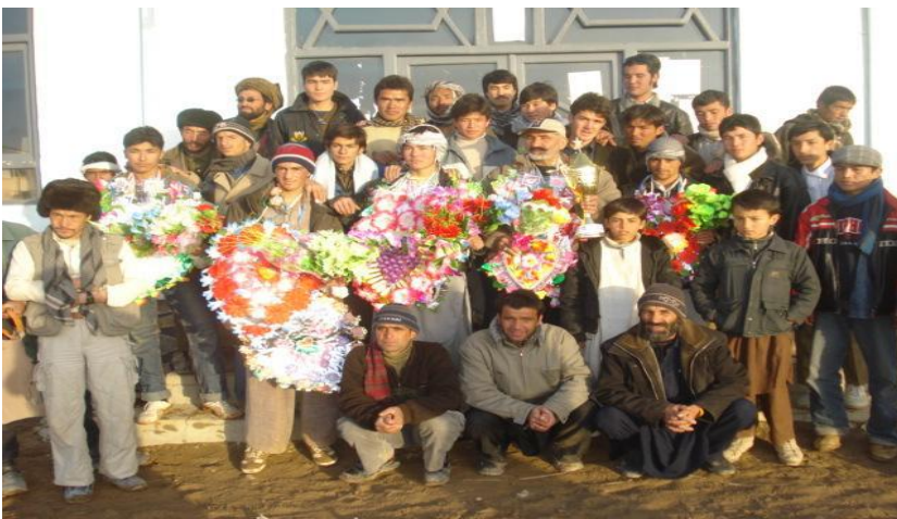
تیم کارته غور در مسابقات حایز کپ قهرمانی شدند

از اینکه این هیئت تاجه حد توانسته است اوازه غریبانه مردم غور را به گوش های ناشنای مسئولین بلند رتبه دولت برساند و برای شان این را گوشت زد نمایند که تا کنون شما برای مردم غور هیچ کار