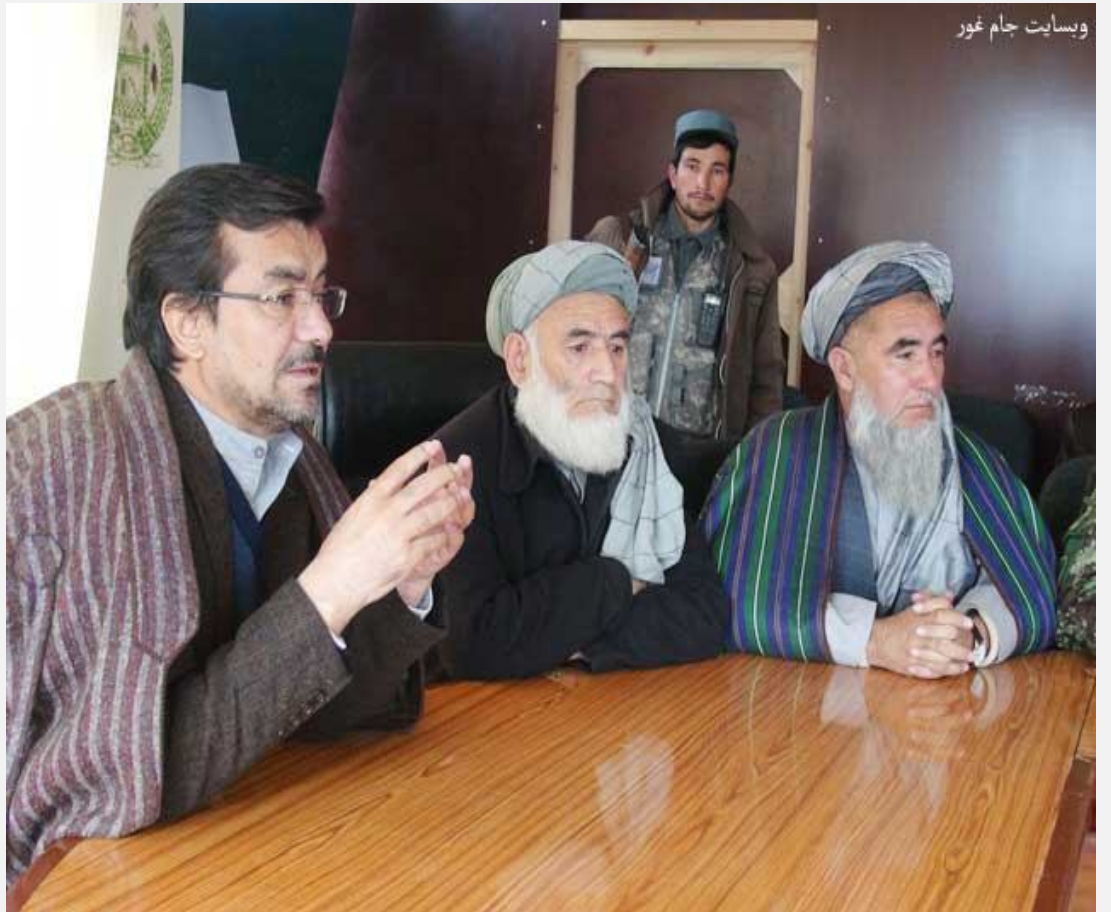
وبسایت جام غور

غور ولایتی است که از لحاظ بازسازی ، در ده سال گذشته کمتر مورد توجه دولت و جامعه جهانی قرار گرفته است . مردم ولایت غور طی این ده سال بار ها صدای خود را از آدرس های مختلف بلند کردند و خواست های خود را با حکومت مرکزی در میان گذاشتند . اما این سر و صدا ها همواره با وعده های کمتر عملی مسئولین حکومت مرکزی پایان یافت . این بار وکلای شورای ولایتی غور دروازه شورای ولایتی را به رسم اعتصاب بسته کردند و با معترضین تعهد کردند ؛ تا زمانیکه حکومت در ساختن برق و اعمار سرک مرکزی پاسخ مثبت نکوید ، به اعتصاب خود ادامه می دهند و دروازه شورا را باز نمی کنند . در پی این اعتصاب ؛ دروازه شورای ولایتی غور برای سه روز بسته ماند .