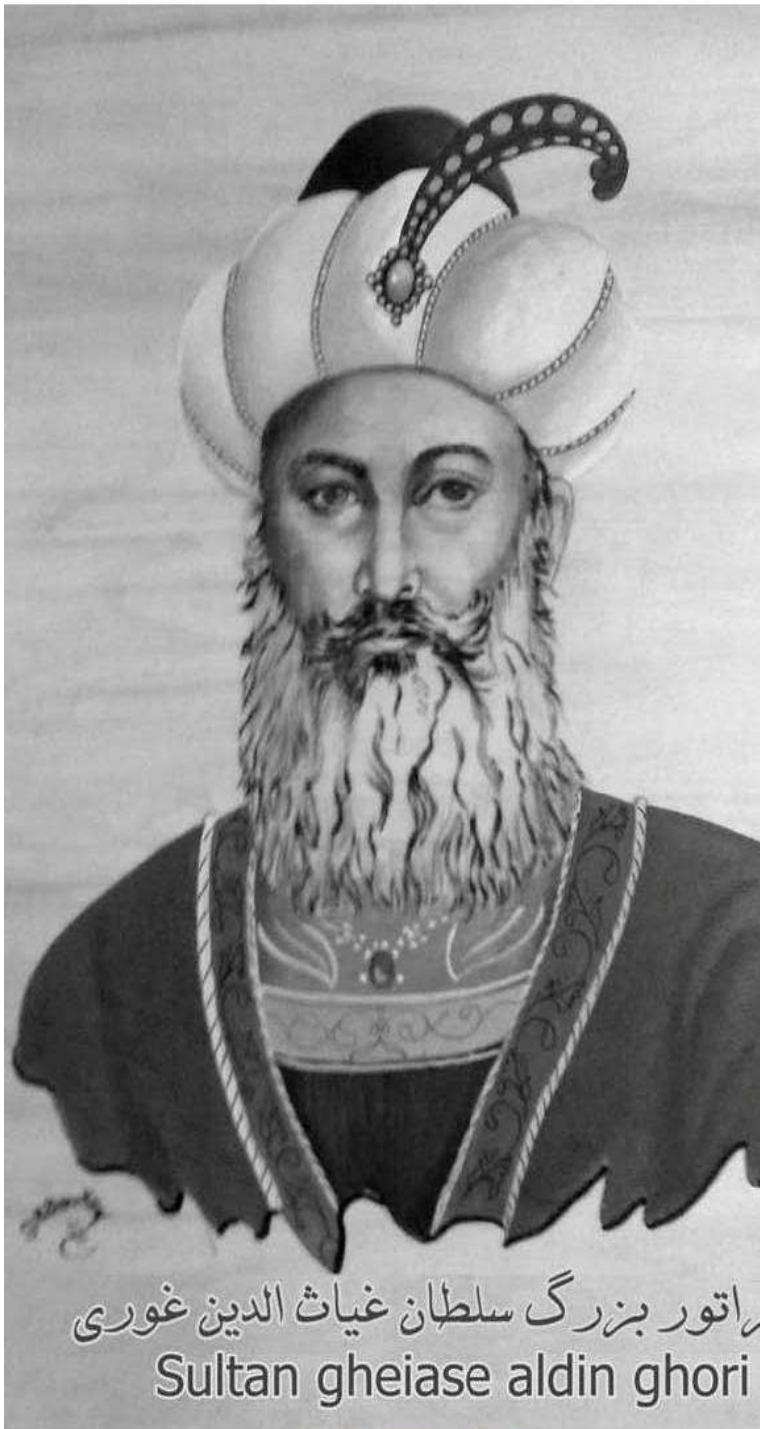
راتور بزرگ سلطان غیاث الدین غوری Sultan gheiasse aldin ghori

با ابراز تشکر از حاکمیت و نیروهای امنیتی غور بیاد مجسمه سلطان غیاث الدین غوری و منار فرهنگی سام که ویران و نابود گردیده است .