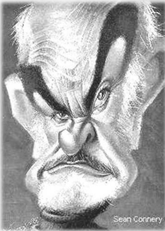
وب Sean Connery

مقصد و کبلان را عاقلانه سنجیدیم مشرب وزیران را عالمگه سنجیدیم خاک پاک افغان را عارفه گردیدیم هر چه را نباید دید ما بکان بکان دیدیم این زمین بی حاصل جای آبجاری نیست در جبین این ملت نور رستگاری نیست هست مدت ده سال خاق پارلمان دلرند از فساد به آسمان عدل بسته رسمان دلرند اندربین افغانستن جنگ دشمنان دلرند کار ملت مظلوم عبر آه زاری نیست در جبین ان ملت نور رستگاری نیست جای قمری و بلبل در چمن کلاغ آمد جای ساهه شهرین زهر در تیغ آمد بهر خوردن لنگور خرس و خوگ چاق آمد بلعبان بیا بنگر اجنبی به باغ آمد چشم و گوش را بگشا روز میگساری نیست در جبین این ملت نور رستگاری نیست میریزد ز چشم خلق اشک خون فشان امروز رفت زانتحار و جنگ بر فلک فغان امروز نیست در افغانستان طاقت و توان امروز رفت مملکت از دست ای برادران امروز گوئیا در این کشور هیچ مرد کاری نیست در جبین این ملت نور رستگاری نیست از خصومت اشخاص وز تقاف درینه میشود به هر هفته پیمال کابینه میزنند از این تقاف خلق بر سر وسینه چاره بهر این ملت عبر برد باری نیست گر چه ما به دام عم هم چو مرغ در بندیم بر ترقی و صلح باز آرزو مندیم دل زعبر برداشتیم خیمه از جهان کندی راه صلح و آزادی بر آن خوب می سنجیم بهر رفیع این بحران سعی در مجاری نیست در جبین این ملت نور رستگاری نیست گرد آورنده مرادپان