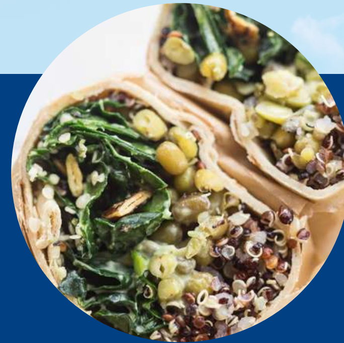
BURRITOS MUNG BEANS