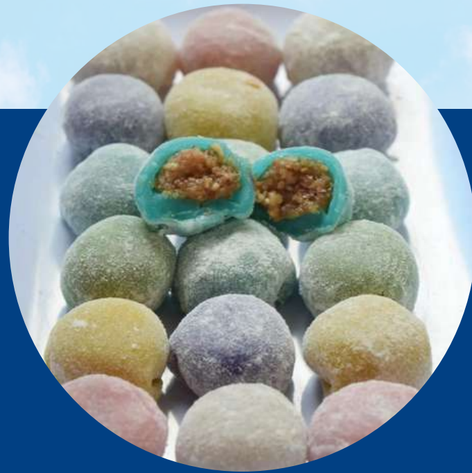
MUNG BEANS MOCHI