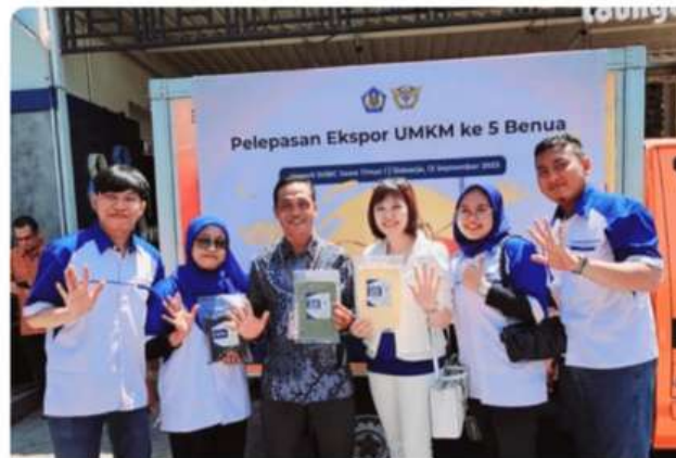
Foto bersama Tim CV. Rajawali Sejahtera Marindo dengan Export Center Surabaya. (Foto: Ist).