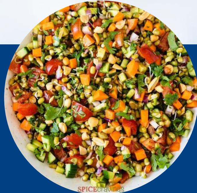
MUNG BEANS SALAD