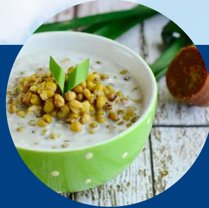
SWEET MUNG BEANS SOUP