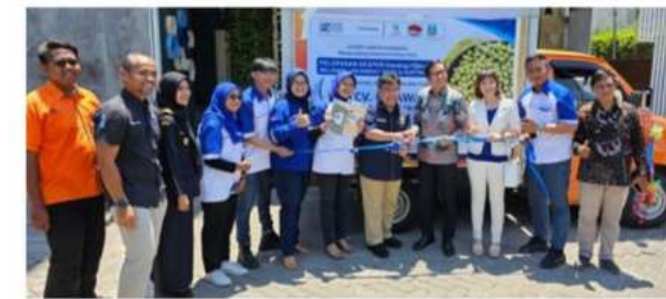
Pelepasan ekspor oleh Direktorat Bea Cukai, Kanwil Jatim I (Dok)