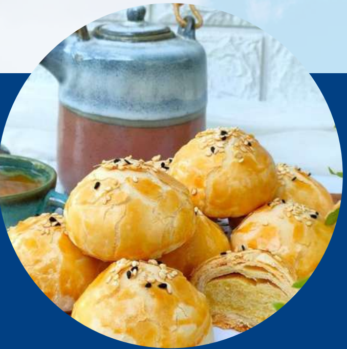
MUNG BEANS PIE