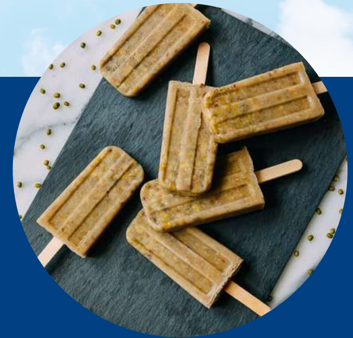
MUNG BEANS POPSICLES