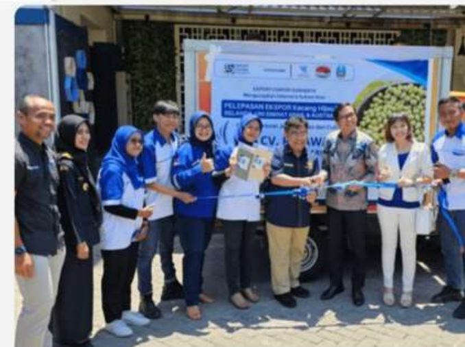
Pelepasan secara simbolis Export Kacang Hijau Yang Diresmikan Oleh Kepala Biro Perencanaan Dan Organisasi Kementerian Luar Negeri Dan Drijen Bea Cukai.

Tak hanya itu, CV. Rajawali Sejahtera Marindo didampingi oleh Export Center Surabaya secara resmi yang siap melepaskan salah satu komoditas unggulannya, yakni Kacang Hijau ketiga destinasi internasional: Belanda, Uni Arab Emirat, dan Australia.