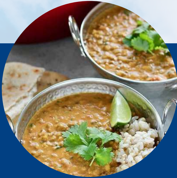
MUNG BEANS CURRY