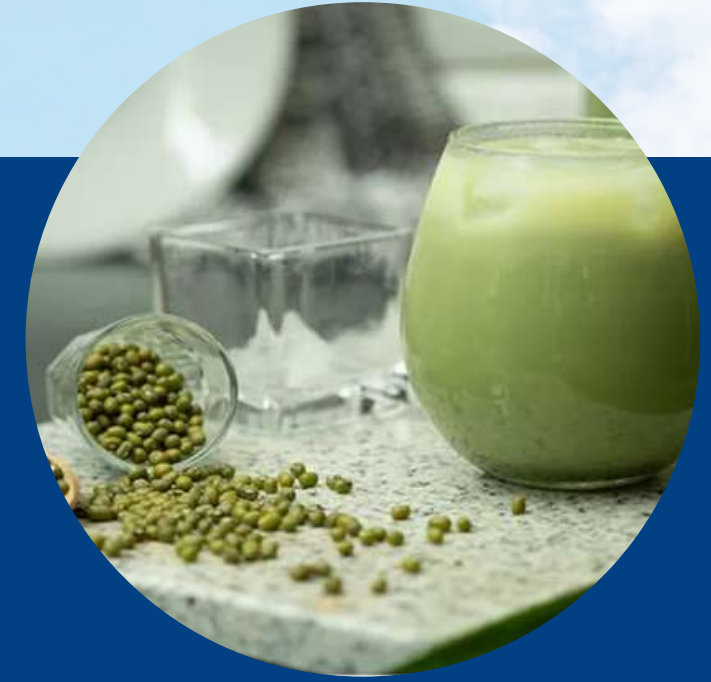
MUNG BEANS MILK