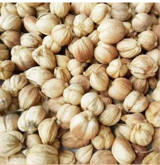
Indonesian White Cardamom (Premium)