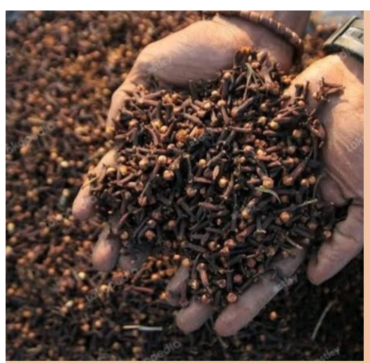
Indonesian Clove (Premium)