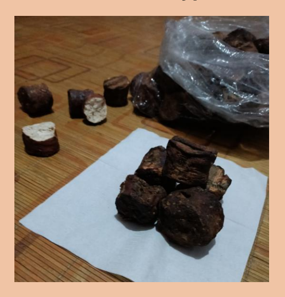
Indonesian Gambir Uncaria Roxb. Type B