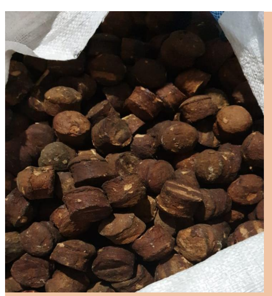
Indonesian Gambir Type B (Lumpang)