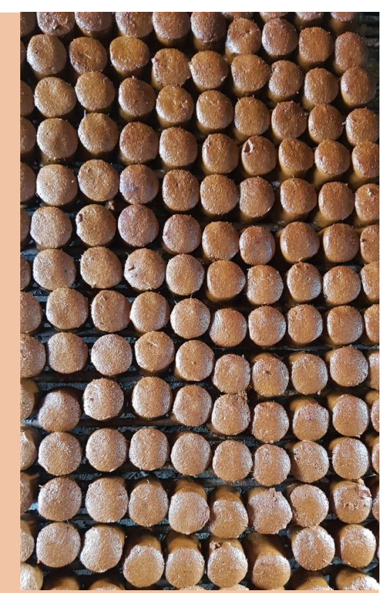
Indonesian Gambir Uncaria Roxb