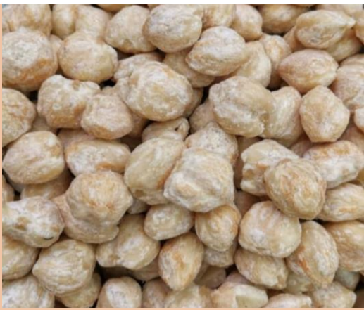
Indonesian Candlenut/Hazelnut (Premium)

Candlenut (Aleurites moluccana) is a relative of Macadamia nuts and resembles them in appearance and in texture but in quite different tastes.