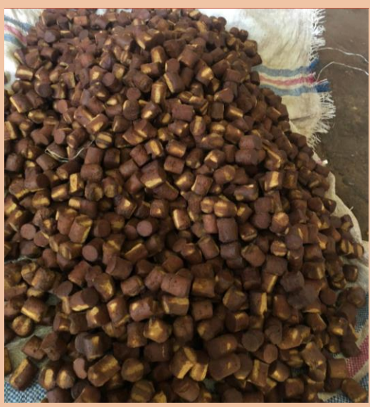
Indonesian Gambir Uncaria Roxb. Type A (Coklat)