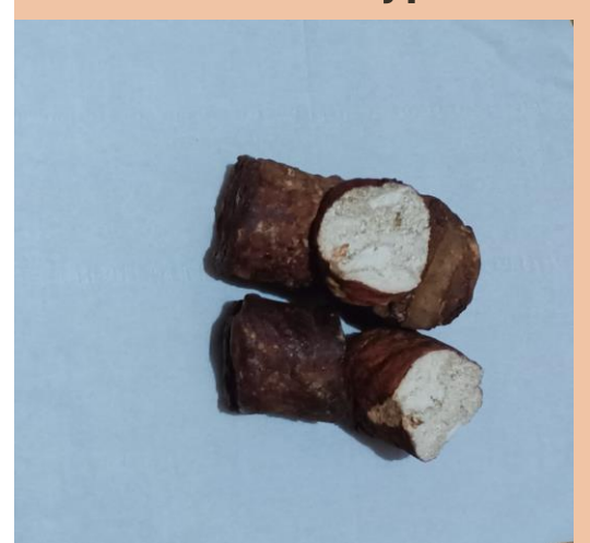
Indonesian Gambir Uncaria Roxb. Type A