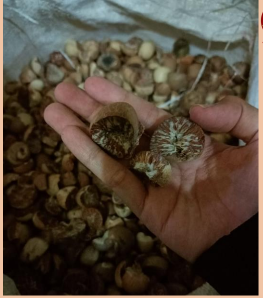
"Indonesian Herb and Spices for your Pharmacies, Food and Drink."