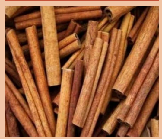
Indonesian Cinnamon Stick (Premium)