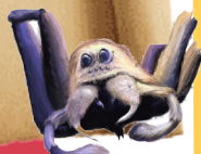
2ème COM C

Si vous voyez des petites araignées en fil chenille se promener dans les couloirs de l'école, pas de panique, ce sont aussi celles des élèves et non les petits d'Aragog, elles ne vous mangeront pas ;)