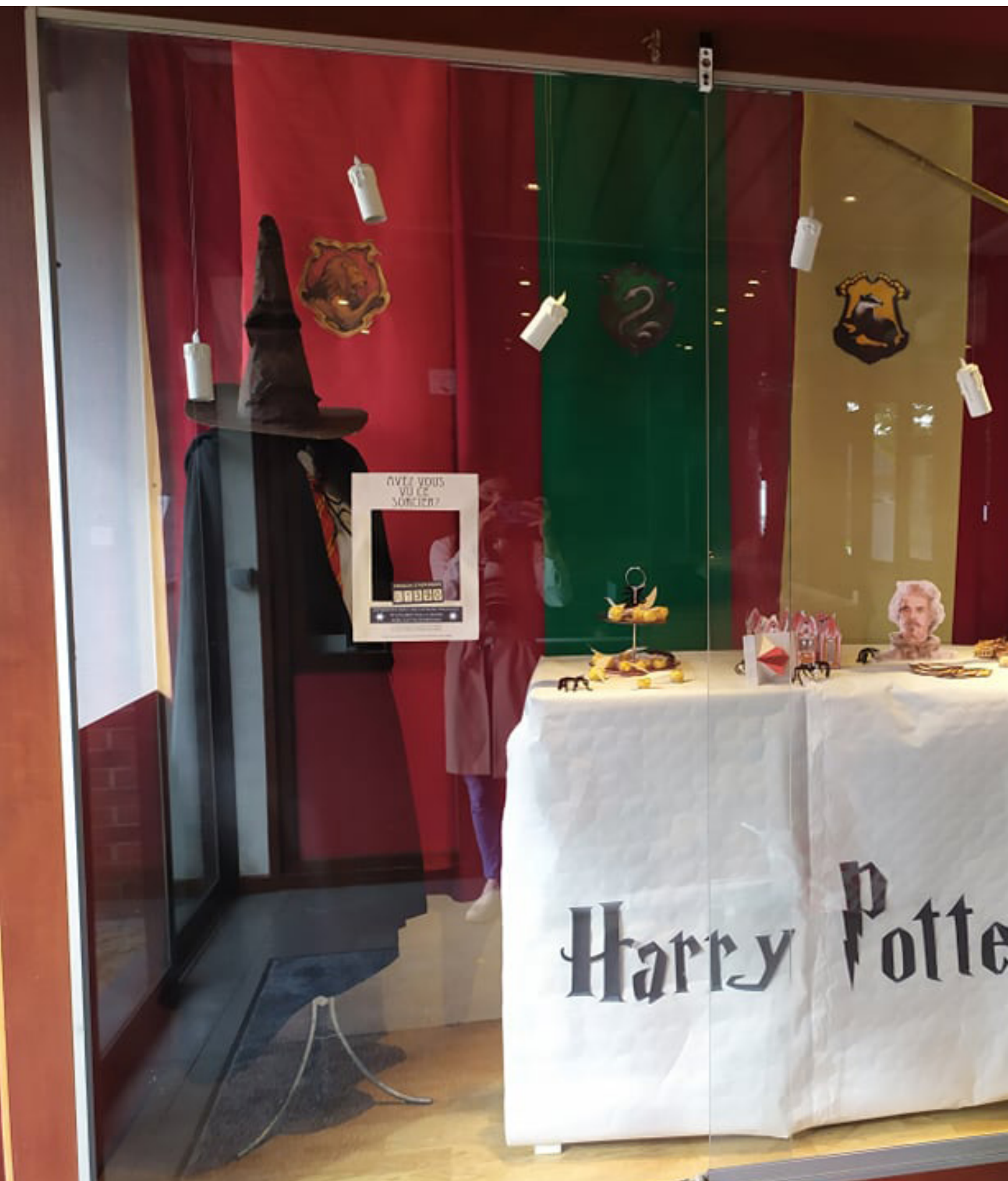
La vitrine des élèves sur le thème d'Harry Potter