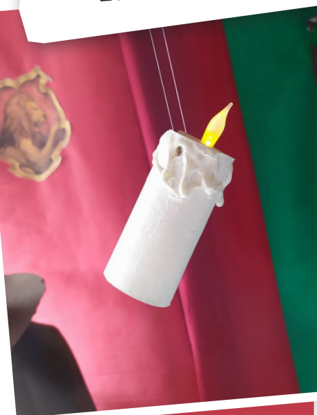
2ème COM A

Les élèves de 2ème commune A ont réalisé avec leur professeur d'éducation plastique, Madame Dendal, des bougies volantes. Ils ont expérimenté la peinture et le pistolet à colle.