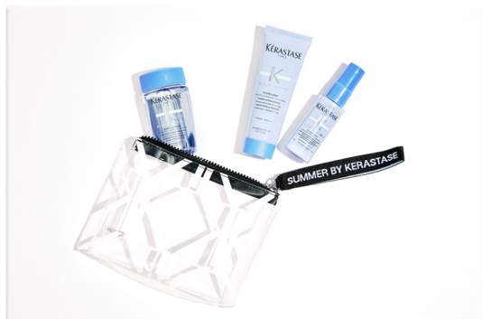
Summer Pouch Blond Absolu "Bain Lumiere, Fluide Miracle & Cicaplasme"