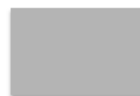
A6 PLAKAT Kr. 17,-