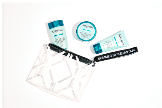
Summer Pouch Resistance "Force Architecte, Masque Force Architecte & Ciment Thermique"