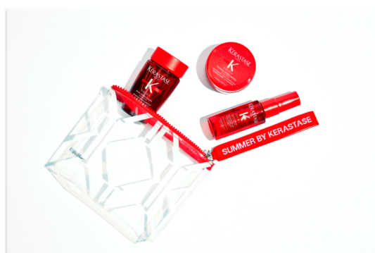
Summer Pouch Soleil "Bain, Masque, & Huile Sirene"

Reisesettene leveres i år i løse deler og må pakkes selv av hver enkelt salong