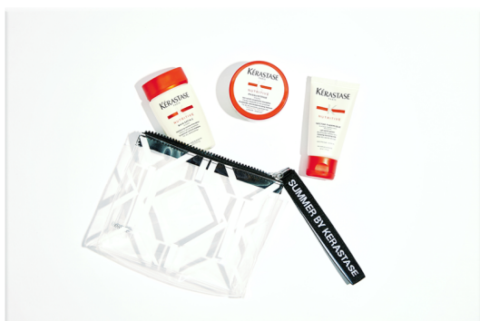
Summer Pouch Nutritive "Bain satin 1, Masquintense & Nectar Termique"