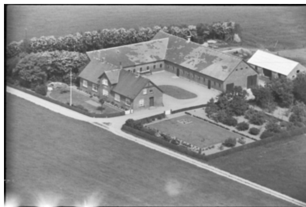
Luftfoto af Tudegård ca. 1950

Luftfoto af området ved Tudegård med gården markeret