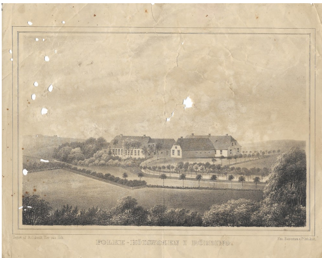
FOLKE-HØISKOLEN I RÖDDING tegnet af A. Schmidt, Elev paa Hsk.

Kort efter sin konfirmation begyndte PPM på sommerholdet på Rødning Folkehøjskole som da havde eksisteret i knap ti år. Det er betegnende for den nationale vækkelse at familien har villet afse midlerne til at sønnen kom på højskole, især da der også måtte være brug for ham hjemme i driften af gård og kro.