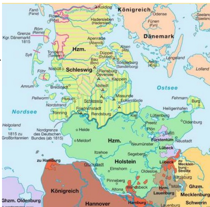
Fig. 1 Kort over hertugdømmerne omkring 1848. De indrammede områder ved Ribe og Tønder hørte under den danske konge.

I foråret 1848 udbrød der revolutioner i mange europæiske stater. Samtidigt var der kommet en ny konge, Frederik VII, i Danmark, og både i København og i Kiel følte man at tiden nu var kommet til at enevælden skulle afløses af en fri forfatning. Det lykkedes ikke at forene de to modstridende holdninger til Slesvigs status, og den 24. marts 1848 brød oprøret ud i hertugdømmerne hvor der blev dannet en regering som hurtigt satte sig i besiddelse af fæstningen i Rendsburg, den stærkeste fæstning i hertugdømmerne.