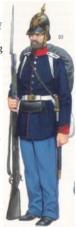
Fig.2. Menig soldat i den Slesvig-Holstenske hær

På forhandlingsfronten skete der kort efter et gennembrud: 2. august 1850 enedes England, Frankrig, Rusland, Sverige og Danmark om at den danske helstat med kongeriget og hertugdømmerne fortsat skulle bestå under den danske konge. Senere tilsluttede Preussen og Østrig sig aftalen. Aftalen betød for S-H'erne at hertugdømmerne skulle tilbage under enevældet, fordi den danske grundlov fra 1849 ikke gjaldt for hertugdømmerne. Aftalen betød også at hertugdømmerne ikke blev knyttet samlet til det tyske forbund. Men Danmark måtte heller ikke knytte Slesvig til kongeriget som oprindeligt ønsket fra dansk side.