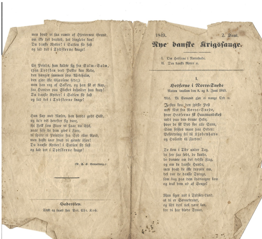
Fig. 4 Skillingstryk trykt i Haderslev 1849 med to viser af N.F.S. Grundtvig

For S-H'erne betød kampen ikke andet end et plaster på sorgen over at oprøret og den enorme indsats over næsten tre år havde været forgæves. Man har givetvis også været stolt over at kunne tage så mange soldater til fange. Hvis man skal bruge en nutidig parallel fra amerikanske film, har S-H'erne nok ønsket at blive mindet med vendingen: 'De døde med støvlerne på'.