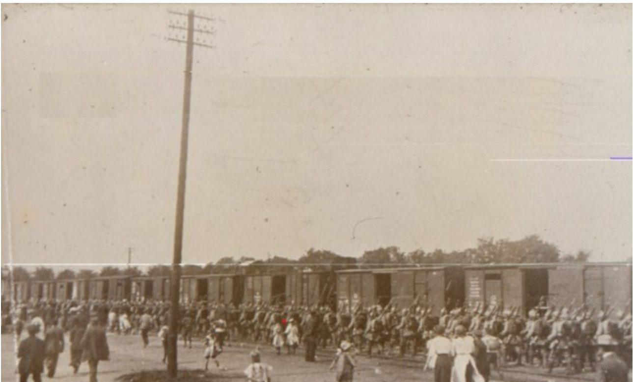
II/Reg. 84 "von Manstein" forlader Haderslev 8 august 1914