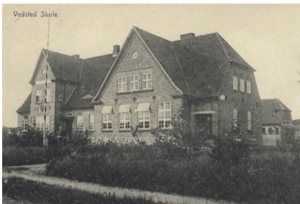
Vedsted Skole ca. 1915