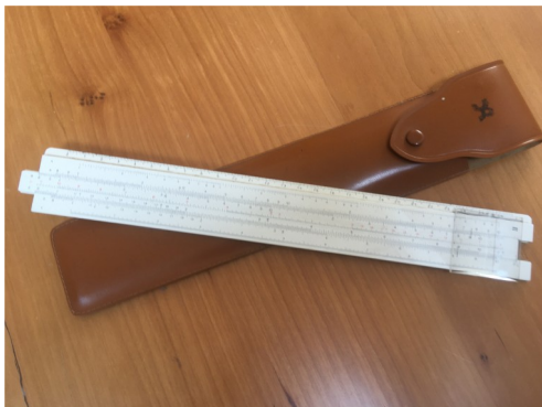
Regnestok af mærket UTO fra Aurehøj Statsgymnasium