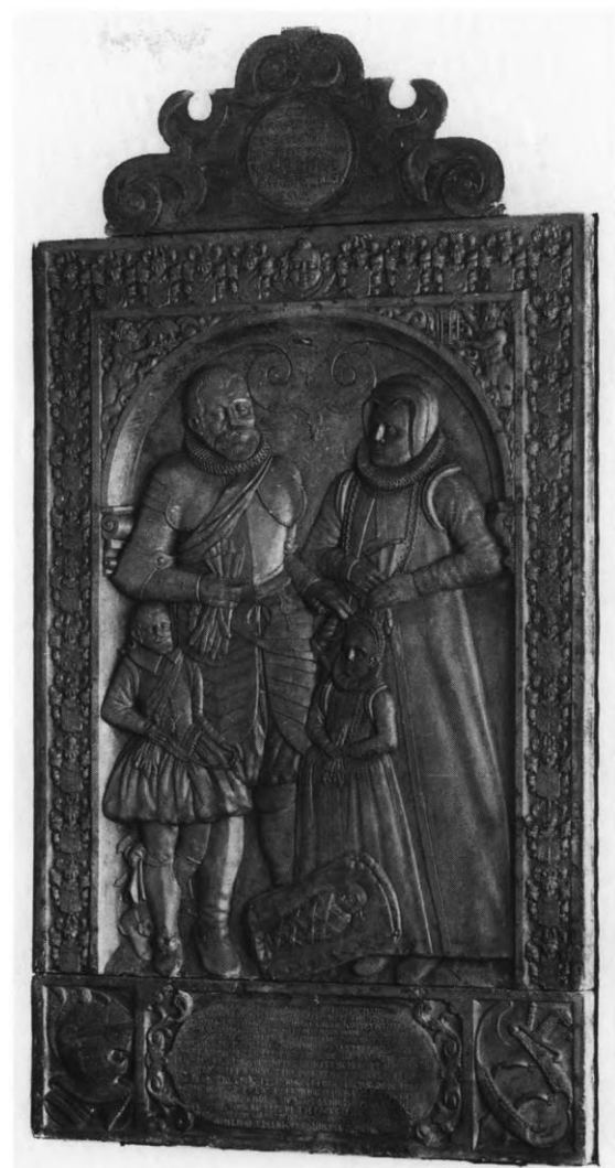
Figur 3. Gravsten(1608) fra Skt. Nikolaj kirke i Holbæk. (Danmarks kirker)