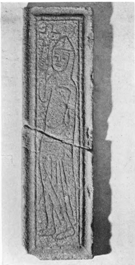
Figur 1. Gravsten (ca. 1250) fra Vejerslev kirke. (Danmarks kirker)

Traditionen med adelige gravsten i kirkerne går tilbage til tidlig middelalder. Fra ca. 1250 findes i Vejerslev kirke på Mors en gravsten der viser en korsridder i rustning og hjelm, men uden våben. Se Figur 1.