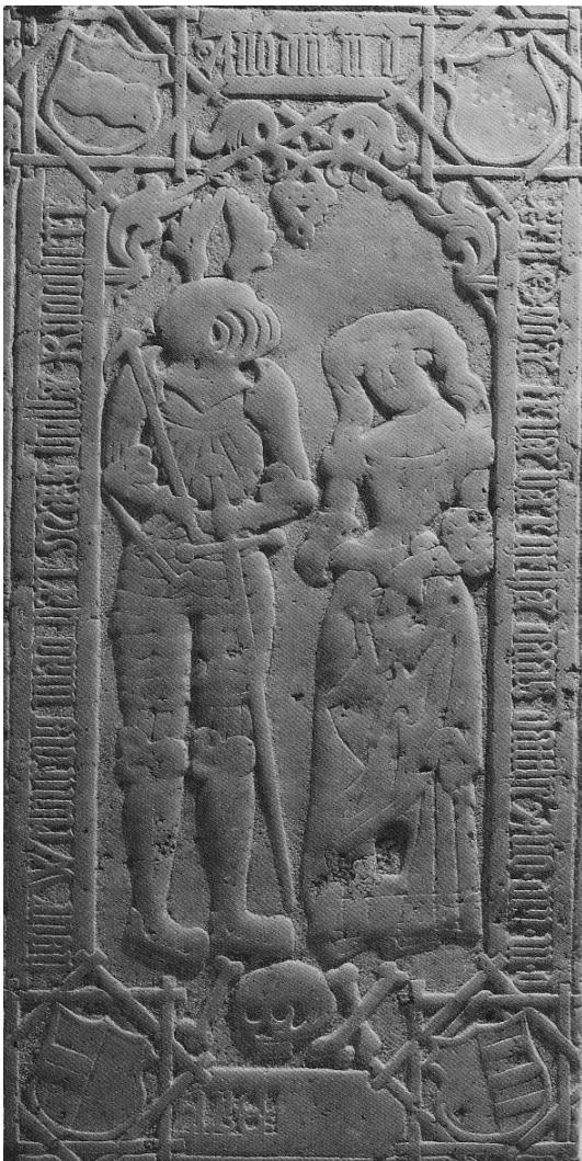
Figur 2. Gravsten (1512) fra Tureby kirke. (Nyborg 2009)

Omkring 1560 begyndte nogen af adelsfamilierne at efterligne den kongelige mode og fik udført gravsten med fritliggende figurer i fuld størrelse; men dette blev under trussel om bødestraf forbudt af kongemagten som nok fandt at en sådan ødselhed var forbeholdt den kongelige familie.