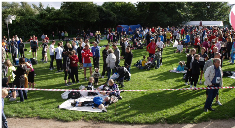
fra Slotsti- løbet 2010