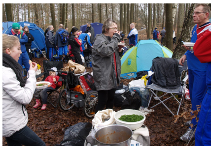
Chili con carne på pladsen – lækkert!