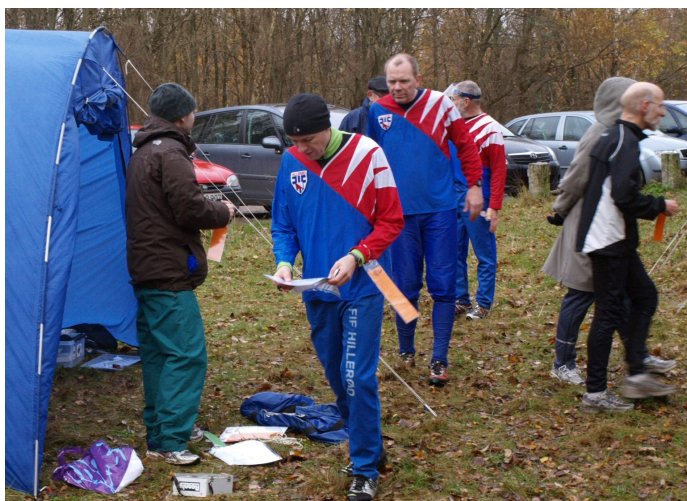
Fra starten ved klubmesterskabet