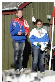
Signe ved MTB-O