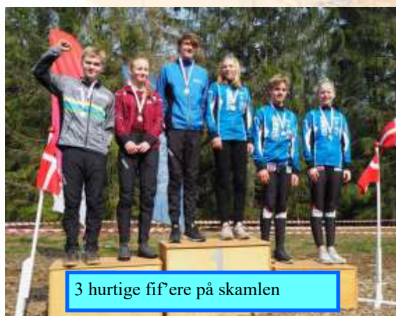
3 hurtige fif'ere på skamlen

De næste mester-skabsmedaljer uddeles i maj måned når der løbes i DM på sprintdistancerne.