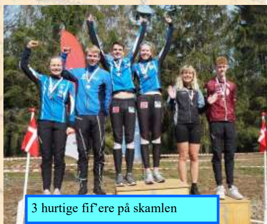
3 hurtige fif'ere på skamlen

De næste mester-skabsmedaljer uddeles i maj måned når der løbes i DM på sprintdistancerne.