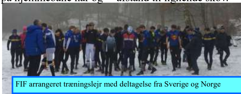
FIF arrangeret træningslejr med deltagelse fra Sverige og Norge

keborg det sidste år. Selve skovene hvor mesterskabet skal løbes i, har i flere år været spærret for træning og fordelten er alene den korte afstand til lignende skov.