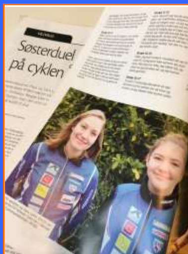
Stort portræt af FIF MTBO ryttere i magasinet Orientering

fiforientering.dk Følg ungdom og elite på Facebook