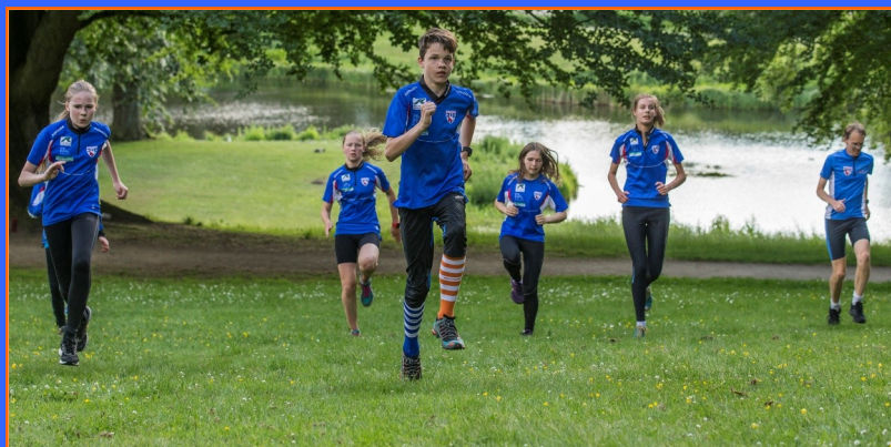
Unge fif'ere der træner løbeskole i Slotsparken

fiforientering.dk Følg ungdom og elite på Facebook