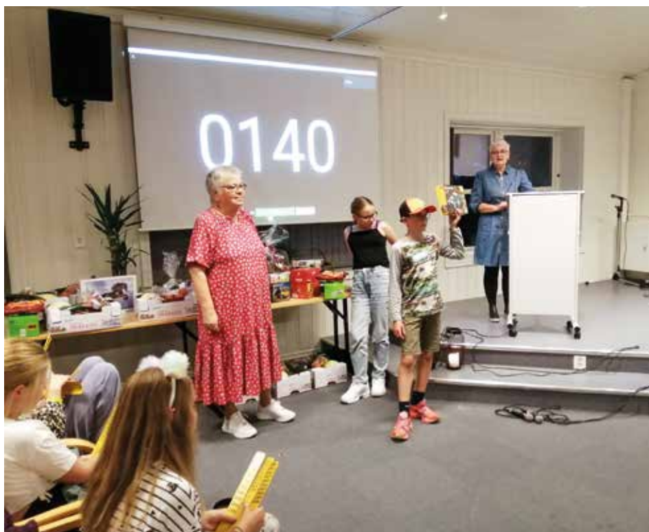
Mange flotte gevinster på årsalget.