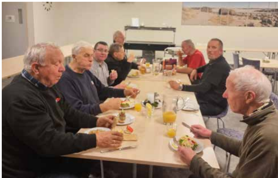
Kvar onsdag ettermiddag/kveld er ein flott dugnadflokk samla på Ognatun.

Ognatun med sin store bygningsmasse merkar også godt at strauprisane er høgare enn før. Dette er ein større utgift enn tidlegare sjølv om leirstaden får noko straumstøtte.