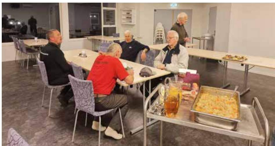
God mat og god prat er viktig etter ei økt med dugnadsarbeid.

Ved utgangen av august hadde Ognatun opparbeida seg eit driftunderskot på ca 870 000 før avskrivningar. Rekneskapen viser at det var dei 3 første månadane som opparbeida det meste av underskotet. Perioden mellom jul og påske er tradisjonelt ein periode med lite aktivitet på Ognatun.