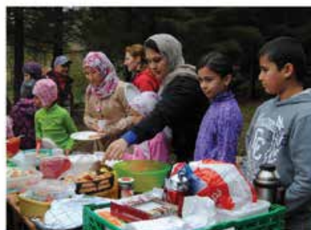
Bli med og gjør Norge varmere!