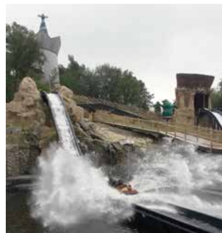
Vannsprut, lek og moro i Kongeparken.