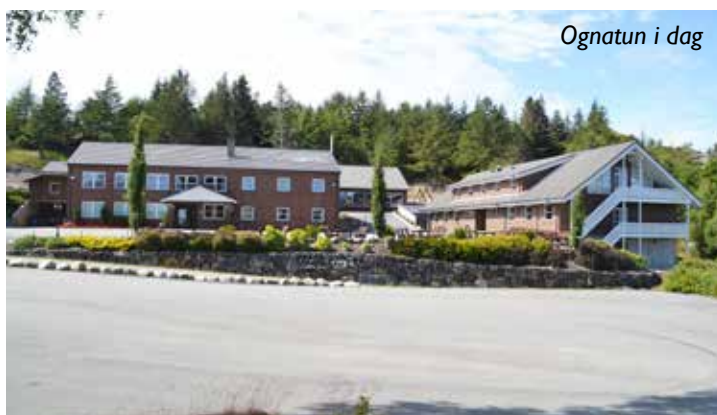
Ognatun i dag