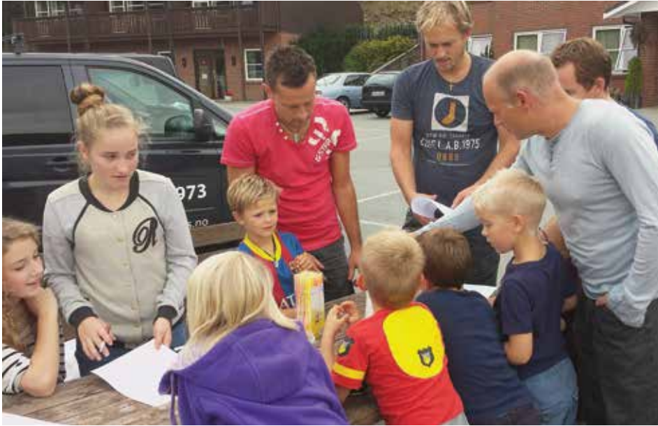
På leir med far.

Vi gleder oss over at det i flere foreninger og forsamlinger rundt om letes etter og prøves ut nye måter å drive arbeidet på. Hverdagslivet og kulturen til det folket vi skal nå er i kontinuerlig endring, og derfor kreves det endring i våre metoder og strategier. Eksempler på tiltak som er satt i gang er samlivskurs, alphakurs, foreldrekurs, billige familiemiddager på bedehusene, godhets- og diakoni-tiltak og grupper og foreninger som hjelper enkeltmennesker i vanskelige situasjoner. Vi takker Gud for all denne oppfinnsomheten, og ber om at dette må bre seg og gi evige resultater. Vi er minst like takknemlige for alt flott arbeid som har vært drevet i lengre tid og som fremdeles bærer frukter.