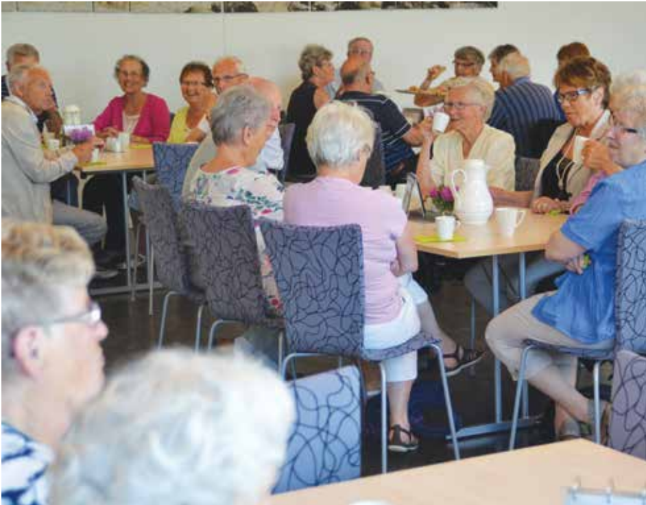
Kaffidrøs på seniorleir.

To kvelder var på Saron på Bryne mens en kveld var på Klepp stasjon bedehus.