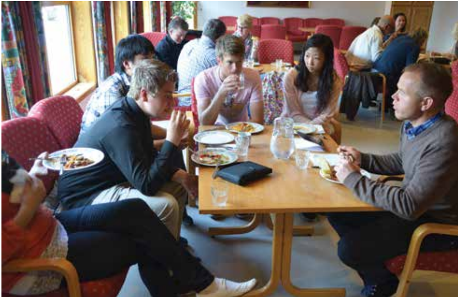
På Guds dreieskive, viktig med måltidsfelleskap.