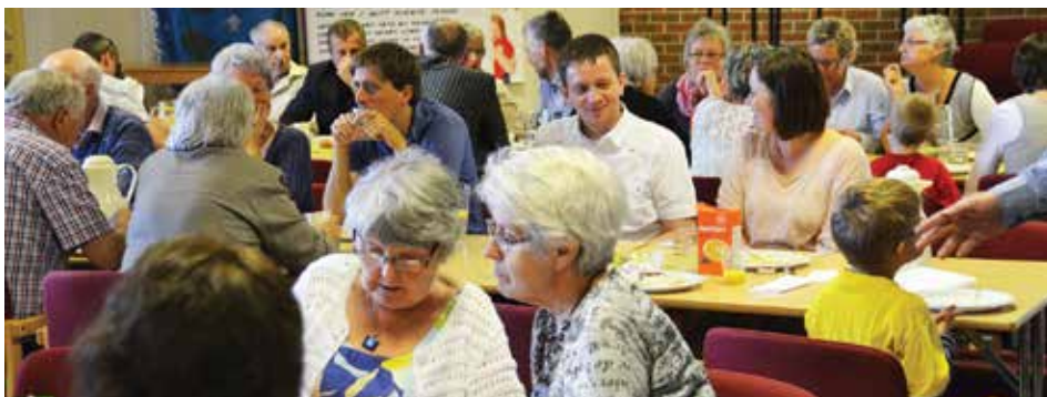
God stemning rundt borda på årsmøtet, då maten blei servert.

I adventstiden gav Jærbladet oss et flott oppslag som fortalte om julefeiringen. Overskriften satte fokus på at vi ikke kan hjelpe alle, men den gav oss faktisk et puff til å prøve å hjelpe flere. Derfor satte vi i gang innsamling til de som skulle feire jul på asylmottaket på Nærland og fikk tak i strikkesokker til hele gjengen der. Etter overleveringen mottok vi dette takkebrevet: "Tusen takk til Rogaland IMF og deres gode medhjelpere som har samlet inn penger og strikkesokker slik at store og små beboere på mottaket nå går vinteren i møte med gode varme ullsokker! Vi og beboerne set-