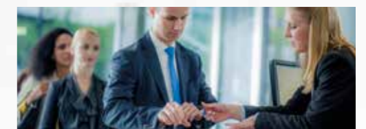
Banken und Finanzinstitute