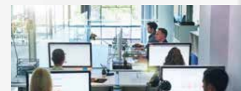
Kleine und mittelgroße Büros und Unternehmensumgebungen