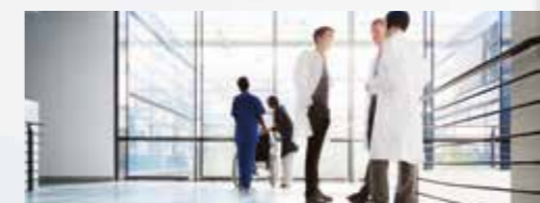
Büroumgebungen im medizinischen Bereich