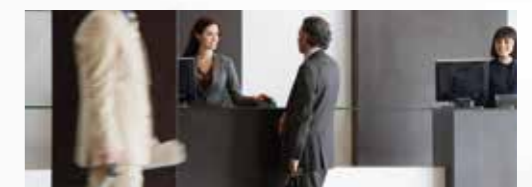
Hotels und Gastgewerbe