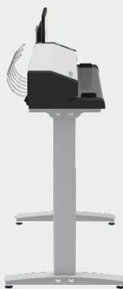
Erforderliche Tiefe weniger als 65cm