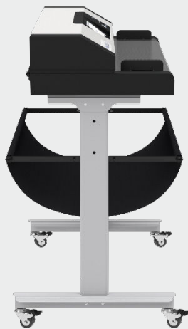
Seitenansicht WideTEK® 36 mit Vorlagenauffangkorb

Um bei durchscheinenden Dokumenten ein optimiertes Scanergebnis zu erzielen, kann der schwarze Hintergrund (Standard) leicht gegen einen weißen getauscht werden.