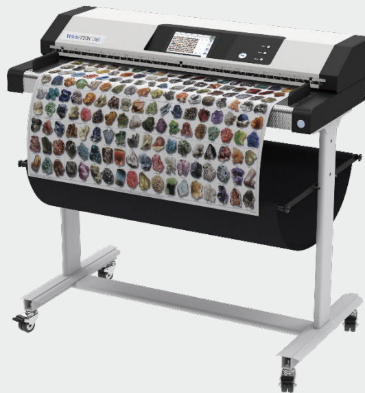
Vorderansicht WideTEK® 36