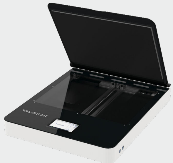
Kratzfeste Glasplatte ermöglicht das Scannen übergroßer Originale