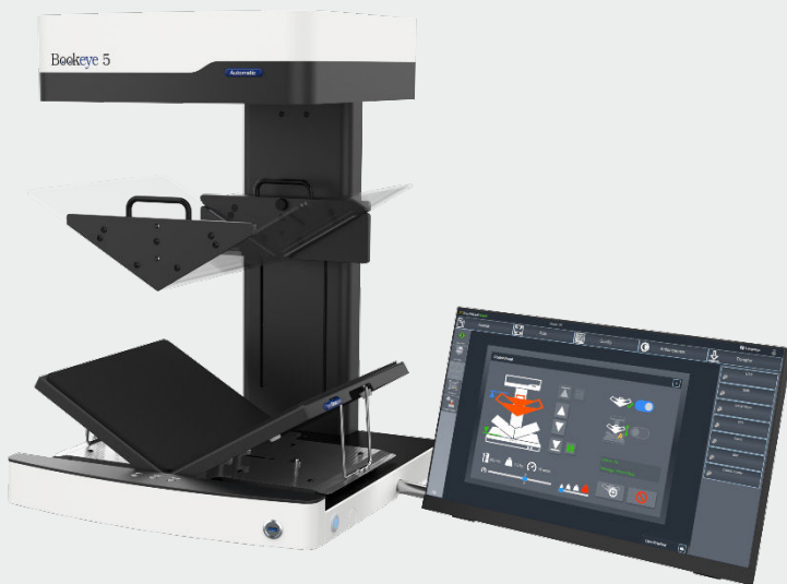
Der Bookeye® 5 V3A Automatic mit V-förmiger Buchwippe und motorischer Glasplatte

Über die erweiterte Bedienoberfläche des ScanWizard wird die V-Glasplatte angesteuert. Das neue Control Panel mit animierten Funktionsbuttons ermöglicht u. a. das horizontale Verfahren nach oben und unten, das Einstellen der Geschwindigkeit oder die Position, in der die Glasplatte nach dem fertigen Scanjob verbleibt. Sie muss nicht zwangsläufig ganz oben oder unten sein. Je nach Bedarf, kann die Glasplatte werkzeuglos und mit zwei einfachen Handgriffen entfernt und wieder montiert werden.