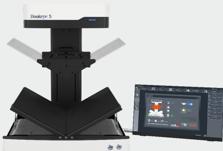
Der Bookeye® 5 V2A Automatic mit V-förmiger Buchwippe und motorischer Glasplatte

Über die erweiterte Bedienoberfläche des ScanWizard wird die V-Glasplatte angesteuert. Das neue Control Panel mit animierten Funktionsbuttons ermöglicht u. a. das horizontale Verfahren nach oben und unten, das Einstellen der Geschwindigkeit oder die Position, in der die Glasplatte nach dem fertigen Scanjob verbleibt. Sie muss nicht zwangsläufig ganz oben oder unten sein. Je nach Bedarf, kann die Glasplatte werkzeuglos und mit zwei einfachen Handgriffen entfernt und wieder montiert werden.