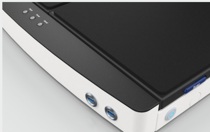
2 USB 3.0 Anschlüsse zum Speichern der Scans auf jedem USB-Stick