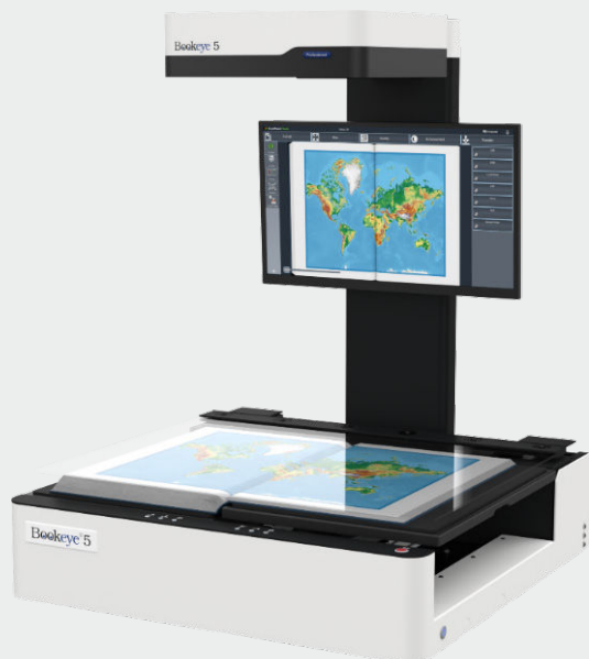
Der Bookeye®51 VA mit flacher Buchwippe und motorisierter Glasplatte

Vor dem Scannen senkt der Motor die Glasplatte auf das Buch, bis der gewünschte Druck erreicht ist. Der Druck wird hochpräzise gemessen und kann unter der Kontrolle des Benutzers bis zu 10 kg betragen. Sobald die Dicke des Buches in der Hubmechanik programmiert ist, muss der Scanner nur noch das Scanglas öffnen und schließen, um das Umlblättern der Buchseiten zu ermöglichen. Die Glasplatte öffnet sich nach jedem Scanvorgang automatisch im benutzerdefinierten Winkel. Die Geschwindigkeit, mit der sich die Glasplatte öffnet und schließt, ist ebenfalls individuell einstellbar.