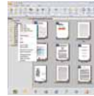
PaperPort SE14 Vollbildanzeige

PaperPort SE 14 ist das von Nuance sorgfältig entwickelte und geprüfte Anwendungslösung für die Nutzung im Büroalltag und häuslichen Gebrauch. Geeignet zum Scannen, zum Teilen und zum Organisieren von Dokumenten bietet das PaperPort SE 14 mit wenigen Schritten den Zugriff auf Ihre Ablage unwesentlich ihren Standortes - sei es mobil über die App-Anbindung oder an ihrem festen Arbeitsplatz.