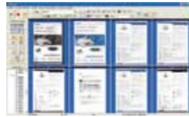
AVScan X Vollbildanzeige

Das intelligente Dokumenten Management Tool