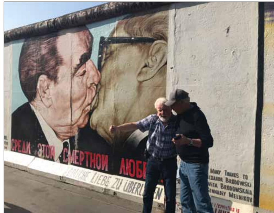
Det blev ingen puss vid Berlinmuren.