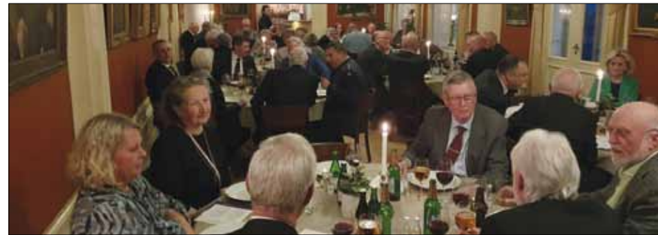
Trivsamt samvaro på mässen efter årsmötet.

att vi är välkomna på de aktiviteter som anordnas av Försvarsutbildarna.