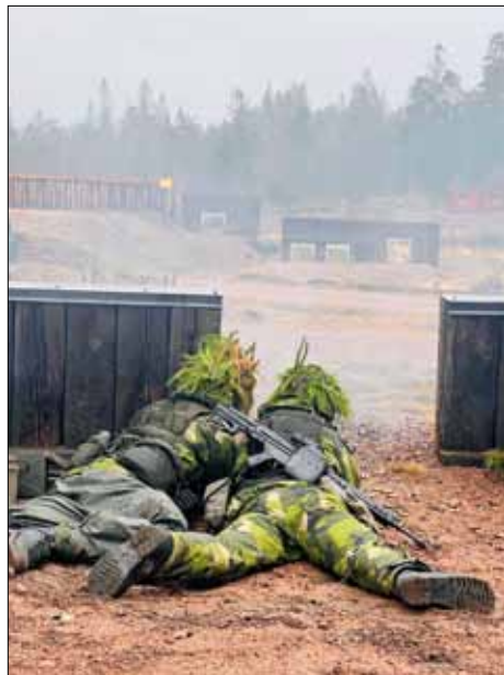
Stridsställning i Striby-anläggningen. Strids-skjutning med hvinsatspluton våren 2023.

Några exempel från 2023 års verksamheter med bataljonen: