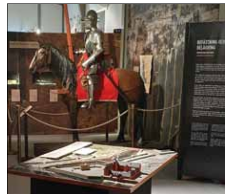
1500-talet med bl a Axtorna och befästningsstaden Halmstad. En riddare från Axtorna sittandes på sin häst (restaurerad av Anna Franciska Nilsson) övervakar besökarna.

från 1500-talet (med Axtorna) fram till våra dagar. En yta är avsatt för tillfälliga utställningar. När detta skrivs finns där en utställning om kriget i Ukraina.