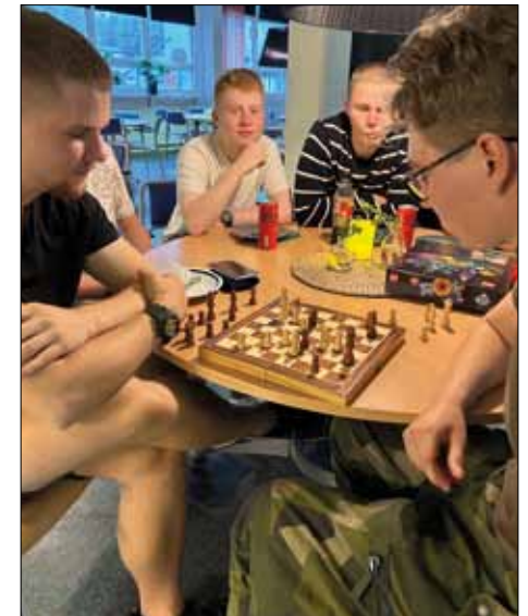
Avkoppling vid schackbrädet.

Vi har möblerat om i lokalen för att skapa mer utrymme för avkoppling och ”häng”, vi