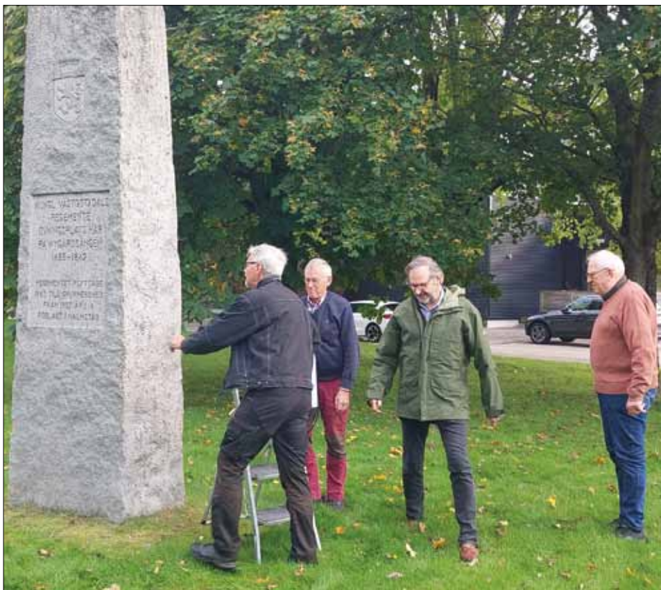
Här jobbar arbetsstyrkan med Nygårdsängens minnessten.

De fyra minnesstenarna är färjeolyckan vid Lilla Edet, sista duellen i Sverige med två duellanter ur Västgöta Dals regemente (föregångaren till Hallands regemente), regemen-