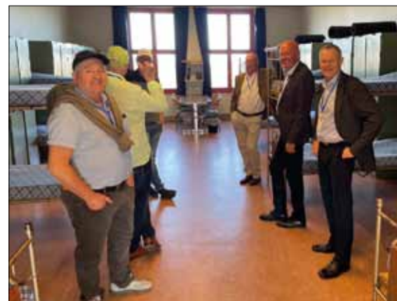
Det gamla logementet.

Efter glada återseenden fortsatte damerna med vinprovning, medan herrarna tog sig in till regementet för att återse de gamla logementen med mera.