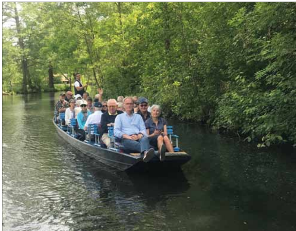
En av tre båtar med färjkarl i härliga Spreewaldlabyrintens kanaler.

Det blev lunch på plats när vi kom i land. Då vi gick till och från platsen vid hamnen passerade vi gurkstråket med Spreewaldgurkor. Dessa gurkor är sorbernas specialitet och de har bott där under mycket lång tid. Sor-