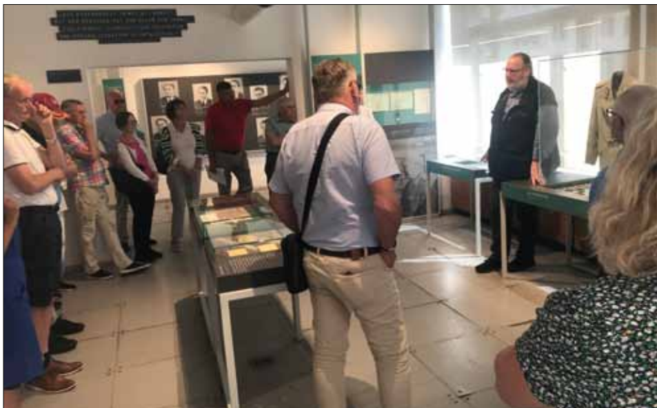
Guidat besök på Stasimuseet.