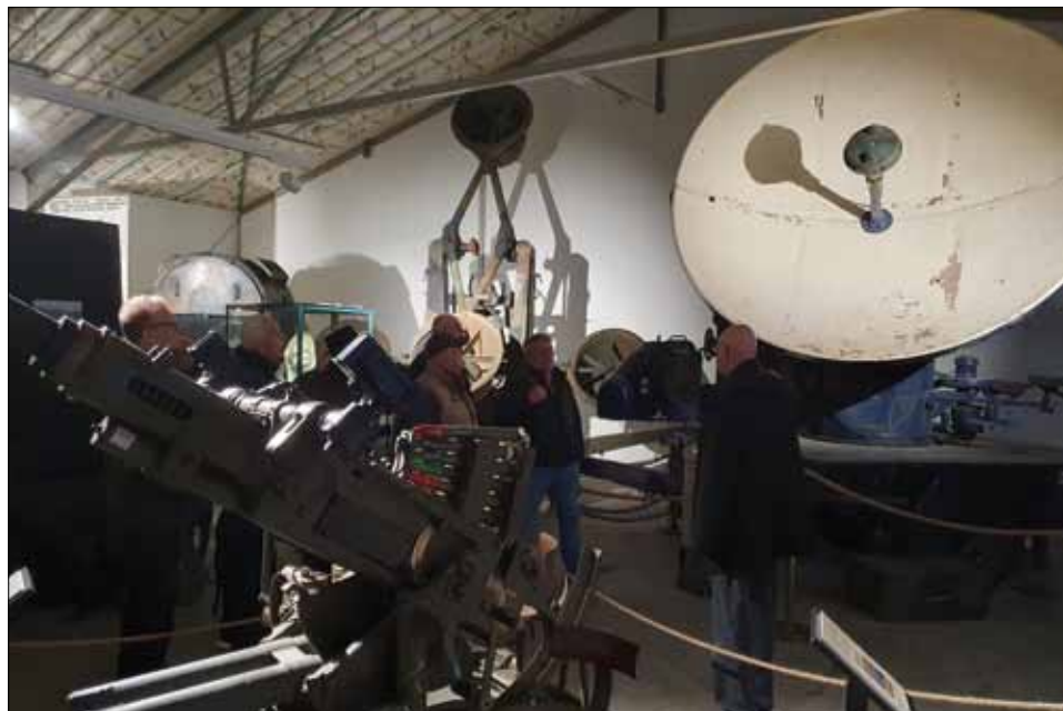
En hel del materiel från luftvärnet finns att beskåda. Lägga märke till den stora lyssnarapparaten i bakgrunden som fungerade utmärkt även i mörker och dimma.

Museet är alltså inte någon ”nyutgåva” av 91:an-museet, med alla dess prylar, utan är ett modernt museum där besökaren kan vandra genom den halländska krigshistorien