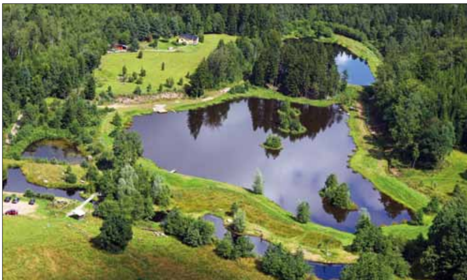
Flygfoto över anläggningen i Vinnalt.

Allt detta tillsammans gjorde att jag bestämde mig för att sluta, så efter 30 år lämnade jag Försvarsmakten. I juni 2010 var det dags att gå ut genom grindarna för sista gången. Det var med blandade känslor, men