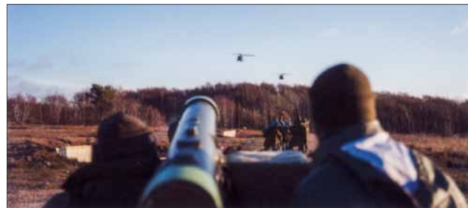
Utbildning av ukrainsk personal.