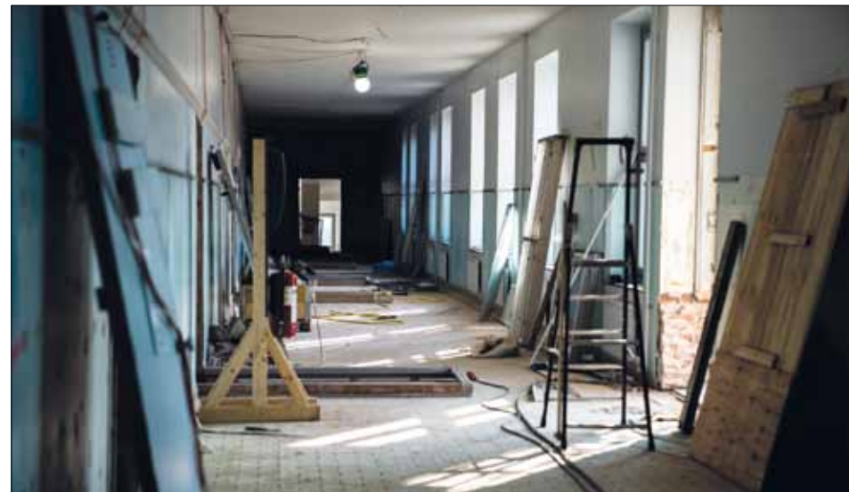
Korridoren med logementen till vänster.

– De fanns överallt här nere. Det var fruktansvärt tungt arbete att montera ner. Det är