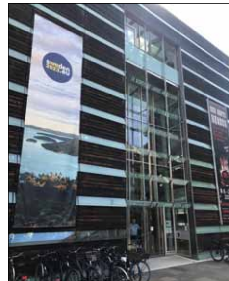
De nordiska ländernas ambassadbyggnad.

Efter frukost på hotellet lastade vi bussen och reste till västra Berlin och besökte svenska ambassaden. Här ligger de nordiska ambassaderna (Danmark, Finland, Island, Norge