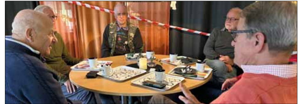
Veteraner och fika – en ypperlig kombination!

VM i militär femkamp hölls sista veckan i augusti här i Halmstad, och även där var