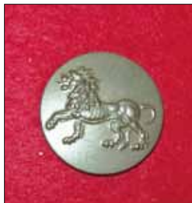
Knapp till uniform m/39.