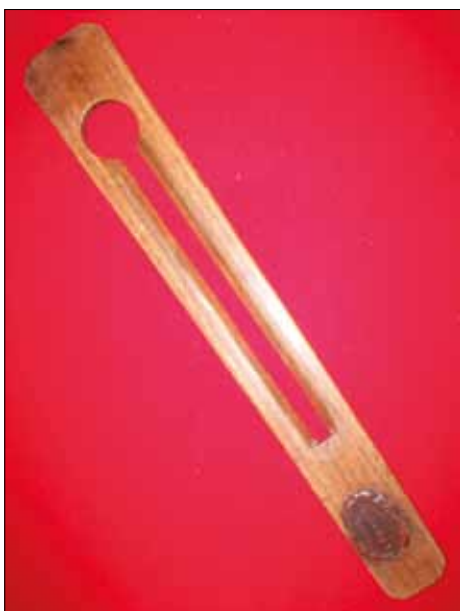
Knappsticka, senare delen av 1800-talet.