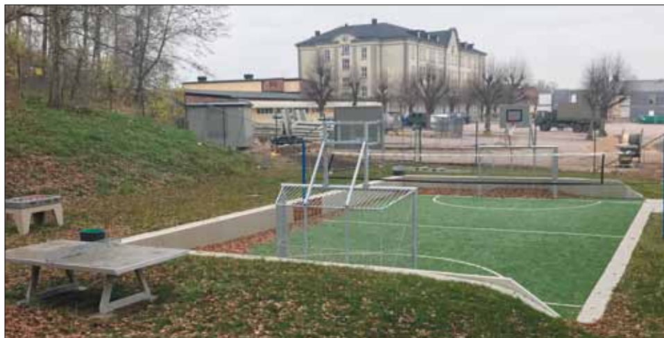
Multiarenan i färdigt skick.