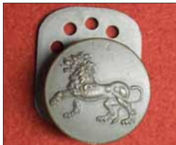
Ryggknapp till uniform m/23, bar upp det då nyinförda kopplet.