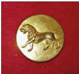
Knapp från 1830-talet.