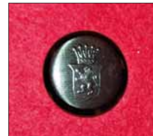
Knapp för mässuppassare, officersmässen I 16.