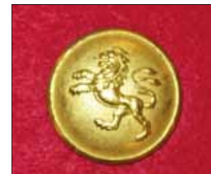
Hallands bataljon m/1813 (Pettersson).