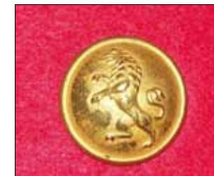
Hallands bataljon m/1813 (Sporrong).