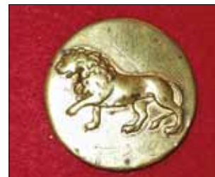
Knapp från senare delen av 1700-talet.

Omkring 1750 kom den så kallade överflödsförordningen då onödigt "glitter" på såväl militär som civil klädsel förbjöds. Från denna tid härstammar de flesta regementsknapparna. Att särskilja regementena med olika knappar ansågs tydligen inte "onödigt", medan däremot alla andra regementsåtskiljande uniformsdetaljer förbjöds.