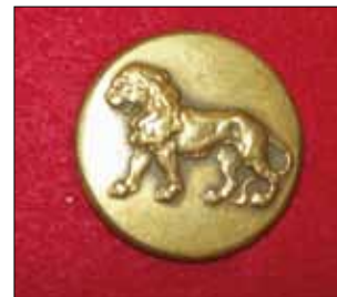
Pettersson-tillverkad knapp från 1870-talet.

Före 1900 var knapparna av mässing utan ytbehandling. Knappen putsades givetvis till höglans. För att skydda uniformstyget användes "putsstickor". De användes även av soldaterna, som hade blanka mässingsknappar utan motiv.