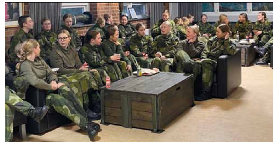
Tjejkväll på soldathemmet.