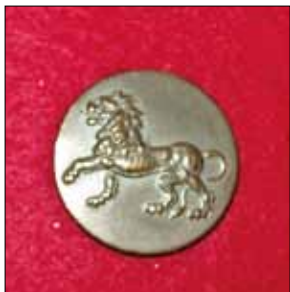
Knapp till uniform m/10 och m/23.