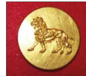
Sporrong-tillverkad knapp från 1800-talets mitt.

Under 1900-talet kom ett flertal ytbeläggningar till uniform m/1910, m/1923, m/1939, m/1952 och slutligen m/1960 (knapp modell 1987 är av samma utförande som modell 1960).