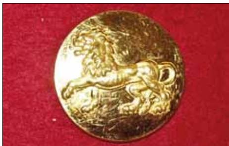
Knapp till uniform m/60 och m/87.