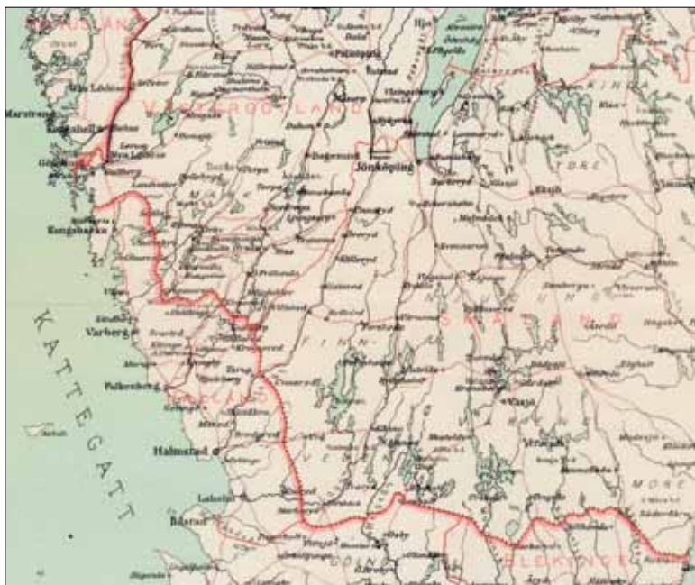
Sydvästra Sverige omkring 1612. (Kungl Första livgrenadjär-regementets historia.)

Den 12 oktober bröt svenskarna sitt fältläger i Jönköping. Knektar och ryttare, jämte artilleri, påbörjade en förflyttning mot Halmstad längs Nissastigen. Mot slutet av månaden befann sig huvuddelen av de svenska förbanden i Halmstad och kung Erik försökte övertala Halmstad att ge sig. Detta misslyckades och när tungt artilleri anlant företogs upprepade stormningsförsök.