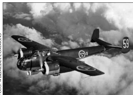
B 18-planet på bilden är i spaningsversion.

Som kuriosum kan nämnas att det tillverkades 245 flygplan av modellen B 18. Det är