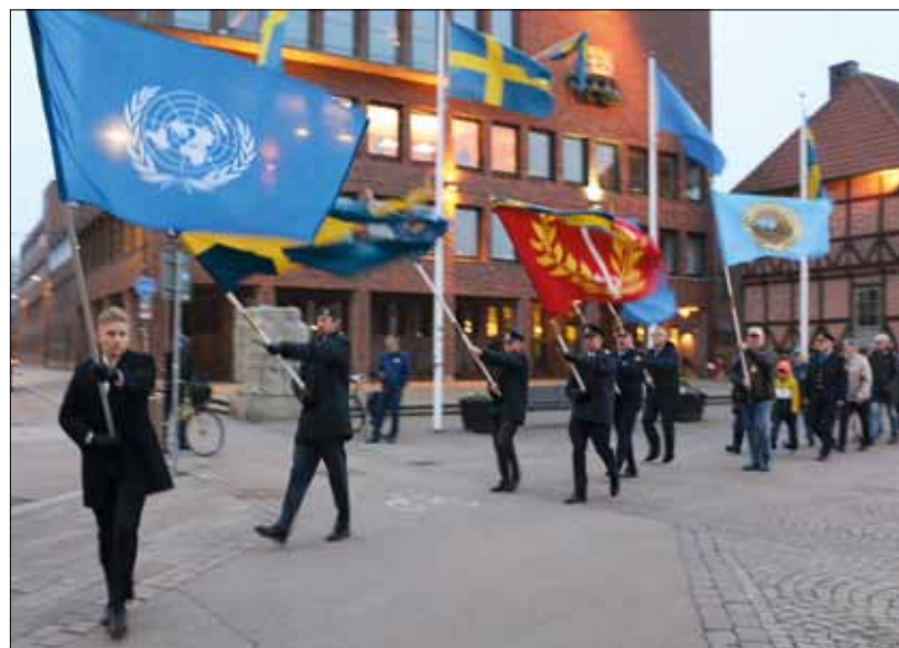
Fanmarsch genom Halmstads centrum.