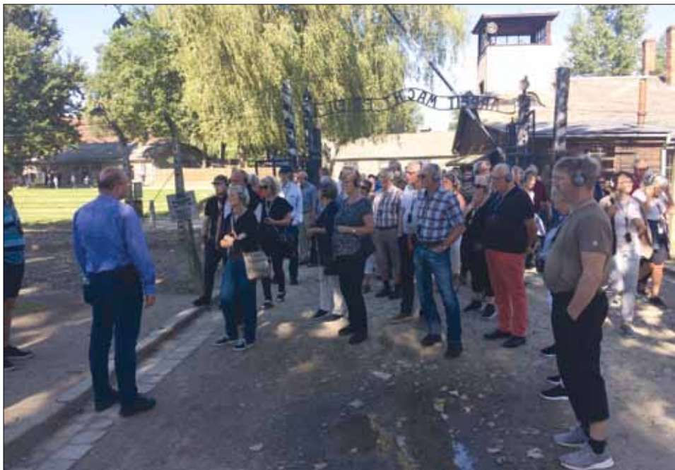
Vår grupp inleder den guidade turen i Auschwitz-Birkenau.