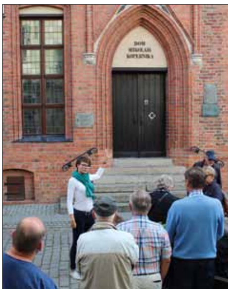
Den andra gruppen under guidad stadsrundtur i Torun.

och Ashif tog över den bussen. Busstransport 24 mil till Halmstad med kort stopp utanför Kristianstad. 15 grader och mulet.