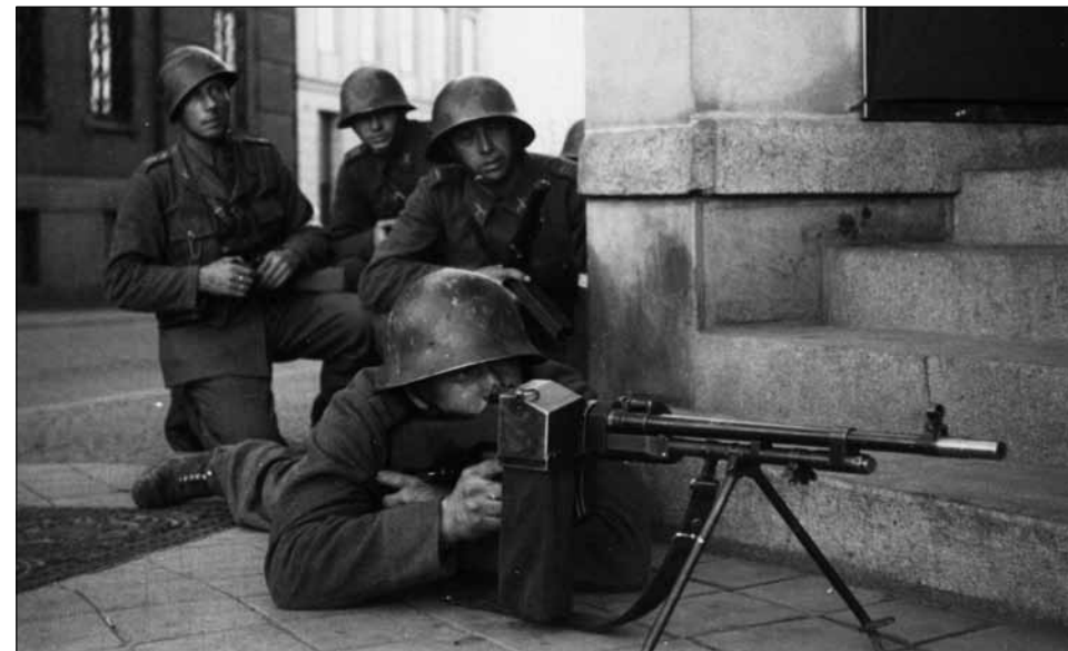
Övning i strid i ort. Halmstads centrum början av 1950-talet. Platsen är vid nuvarande Gallerian.

På armésidan pågick en omfattande modernisering, som givetvis byggde på erfarenheterna från andra världskriget. Repetitionsövningarna fick en bättre struktur och