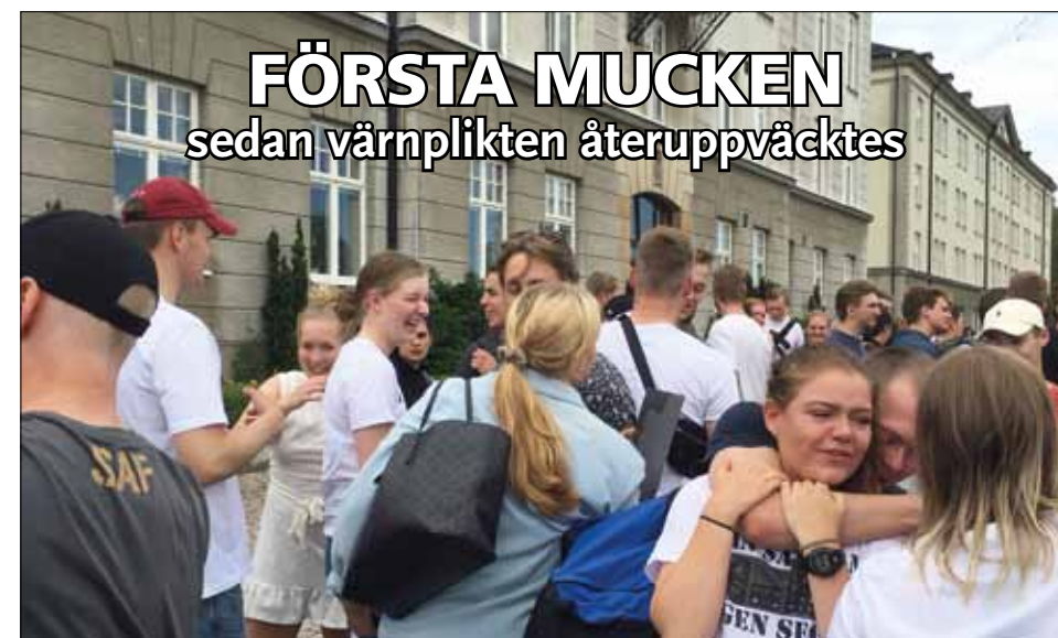
FÖRSTA MUCKEN sedan värnplikten återuppväcktes – Först glada, sedan ledsna, ryckte den första värnpliktsomgången ut från Luftvärnsregementet den 14 juni 2019 kl 12.20.