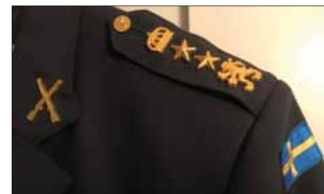
Hallands regementes lejon – vårt förbandstecken!

Tillsammans med HAG har 45:e hemvärnsbataljonen genomfört en rekryteringskampanj under senhösten 2019. En stor mängd brev har skickats ut i Halland. Fram till nu har det resulterat i drygt 100 intresse-