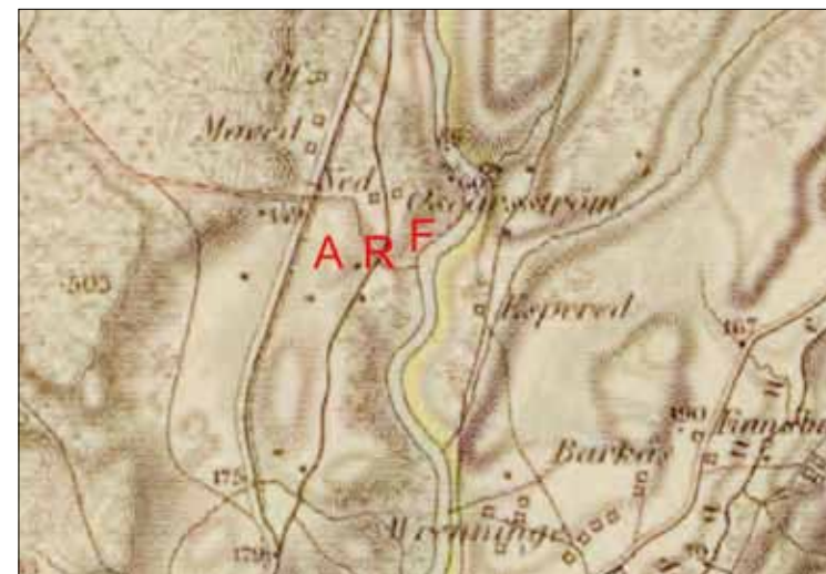
Oskarström 1867 (Lantmäteriet). Ungefärlig gruppering av den svenska styrkan vid slagets inledning. A = Artilleri R = Rytteri F = Fotfolk

Fredrik II, som nu anlant, mötte de reti-