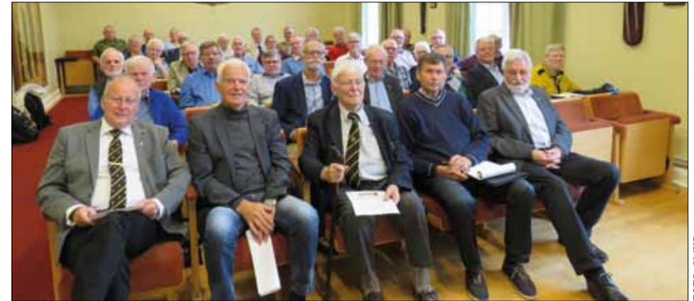
Deltagarna vid regionens höstmöte samlade på gamla I 15 i Borås.