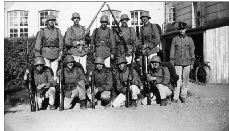
Sjätte kompaniet I 16 sommaren 1932.

Beslut om flottiljens inrättande fattades i 1942 års försvarsbeslut och medförde ett omfattande byggande på västra sidan om Galgeberget. Flottiljen invigdes 1945 i krigets slutskede, och var samtidigt en del i ambitionen att bygga upp Sveriges flygvapen till ett av de främsta i världen.