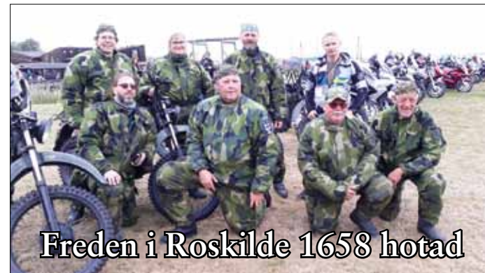
Gänget som gjorde det. FMCK Varberg med förstärkning.

Vi startar 30 juli 2019 i Varberg från FMCK:s lokaler och framrycker till Halmstad. Där hämtas ytterligare personal och materiel för att operationen ska gå i lås.