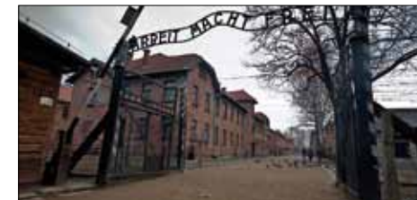
Auschwitz med "Arbeit macht frei"-skylten.

Warszawa Rising Museum öppnades på 60-årsdagen av striderna i Warszawa. Museet är Warszawas invånares hyllning till de som kämpade och dog för ett oberoende Polen och dess fria huvudstad. Det ligger i en tidigare spårvagnsstation, ett 2000-talets landmärke av industriell arkitektur.