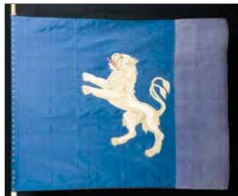
Hallands bataljons fana.

Sommaren 1813 inkallades cirka 600 man i två omgångar från hela Halland. Förbandet som upprättades för att utbilda dessa beväringar kom att få namnet ”Hallands 1:sta infanteribataljon”. Det vapenövas bland annat på den sankta Öster mosse ungefär vid nuva-