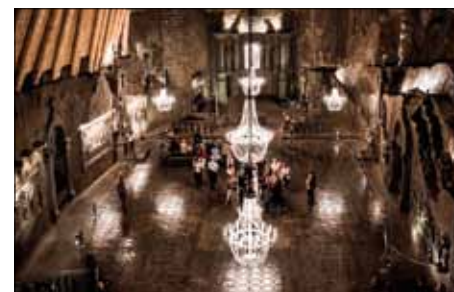
Wieliczka är en av världens äldsta saltgruvor. Det är som en liten stad under mark.

Bigos ("jägargröta") är ett klassiskt exempel på en gryta, ursprungligen beredd av vad helst en jägare (eller tjuvskytt) kunde få tag på. Ingredienserna varierar, men den vanliga grunden för bigos består av hackad vitkål, surkål och torkad svamp, tillagad med fläsk, bacon och zywiecka (polska korvar). Att lägga till lite ister är traditionellt och ger en underbar djup smak.