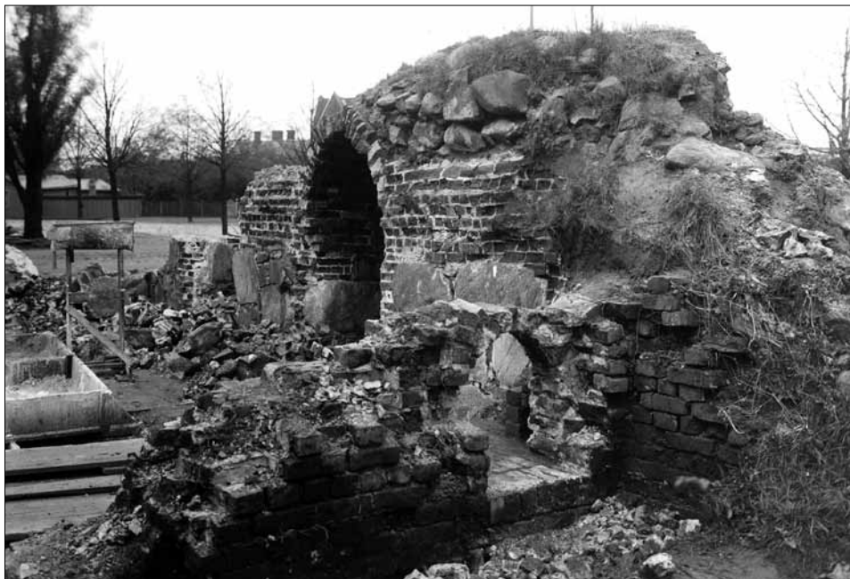
Detalj från utgrävningarna av fästningsverket på 1910-talet.

var utrustad med hillebarder, spjut eller pikar. Dessutom hade 37 man harnesk.