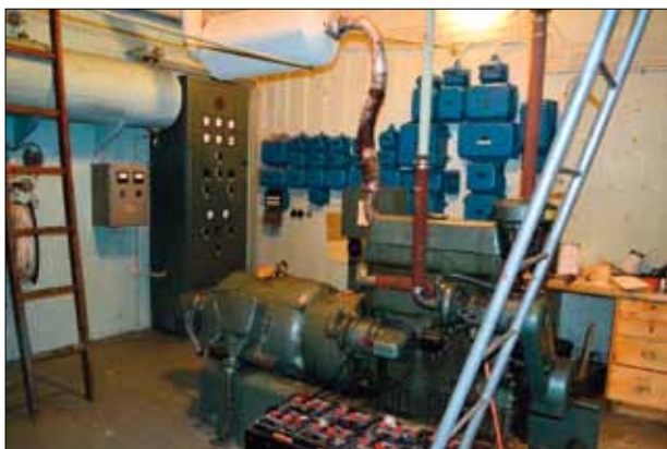
Till anläggningen behövdes rejäl kraft. Denna generator fixade det.

Helst ville man ha ett bergrum men i brist på granit blev det Galgberget som grävdes upp. I ett stort hål göt ett inhyrt betongföretag en anläggning i två plan.