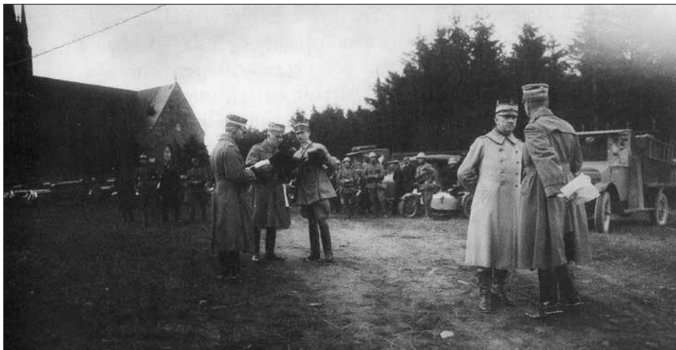
Kronprinsen (med ryggen mot kameran) besöker staben vid Årstads kyrka.

sex radiostationer, så kallade kärstationer, vilka användes för förbindelse mellan huvudkvarteren och staberna. Stationerna hade en räckvidd på cirka 50 mil och kunde upprättas på fyra minuter. Även bärbara stationer fanns. Deras räckvidd var omkring fem kilometer.