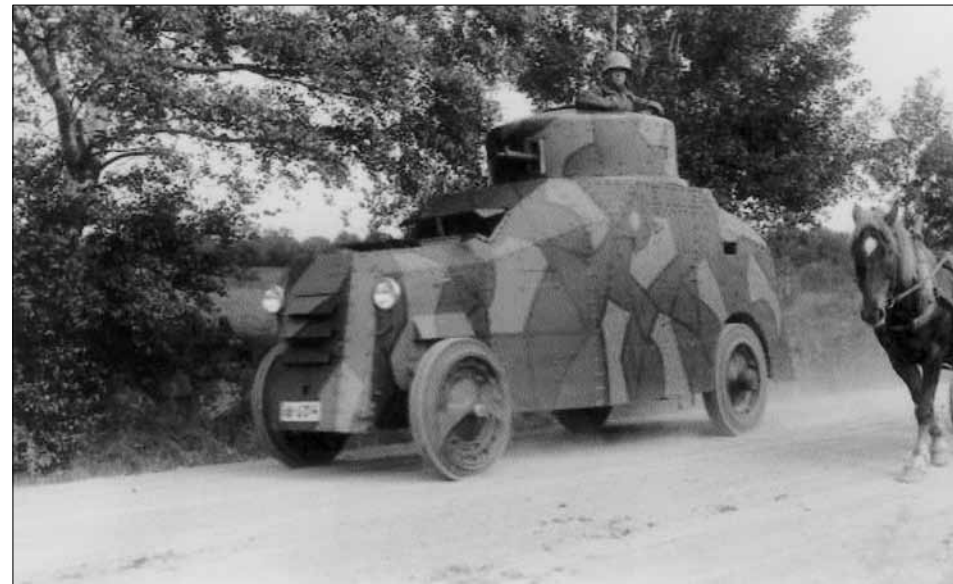
Panzerautomobil nr 3 deltog under övningen.

Från Halmstad rapporterades det att ”Storgatan vimlar av folk, ståtliga kavallerister storma fram genom gatorna och storvuxna svenskar födda söder om landsvägen, ha i