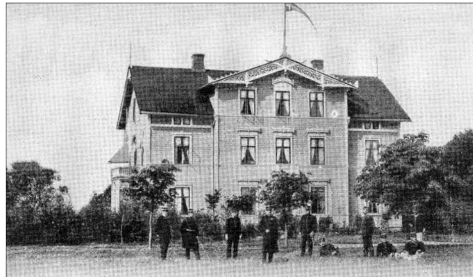
Officerspaviljongen på Skedalshed.

rande Larsfridsområdet samt därutöver tidvis i Varberg och Falkenberg.