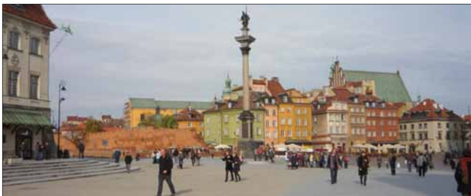
Sigismundkolonnen vid Slottstorget i Warszawa.

Huvudstaden Warszawa är både vacker och modern med charmiga och vackra platser att upptäcka. Här kan du uppleva ett av Europas bästa nattliv, äta på förstklassiga restauranger, shoppa allt du kan tänka dig eller utforska stadens konstnärliga tunnelbanestationer.