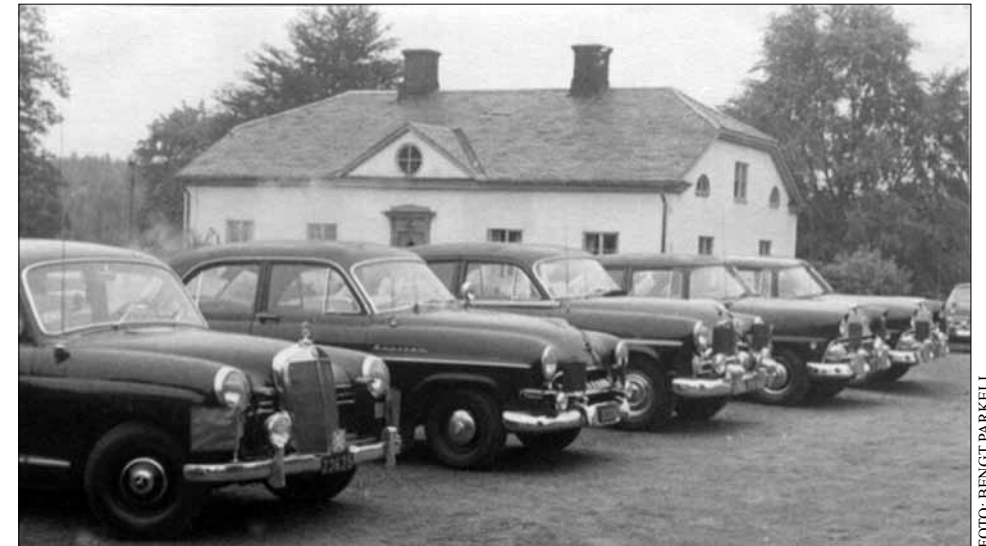
Svartås herrgårdspensionat utanför Laxå under Värmlandmanövern hösten 1957.

En dag fick jag order om att vinterutrusta den bil jag körde, en Mercedes-Benz 170, med vinterdäck, snökedjor, motorvärmare snöskyfflar med mera.