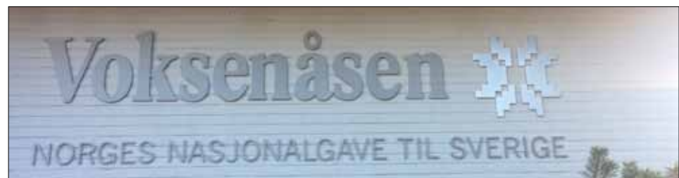
En härlig besöksplats som för mig var resans okända överraskning.

Nästa stopp var Quality Hotel Vänersborg där vi inmundigade lunch. Klara och mätta gick vi till minnesstenen utanför, tillägnad