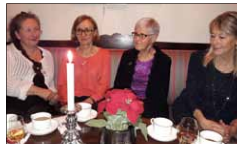
SAMTLIGA FOTON: LARS AHLBERG