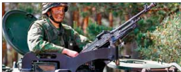
Litauisk kulspruteskytt med fordonsmonterad kulspruta m/58.