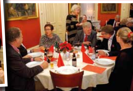
I väntan på att få anträda julbordet.