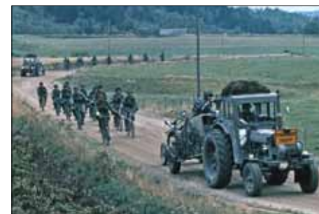
Cykeltolkning – vanligt förekommande vid denna tid.

Regementet ställde förtjänstfullt upp med ett logement så platsen för återföreningen, eller kolonnbildningspunkten, blev kasernvakten. Mötet med vakten var annorlunda. Borta var det korrekta men familjära mottagandet, i stället ett opersonligt strikt agerande bakom mörka fönster.