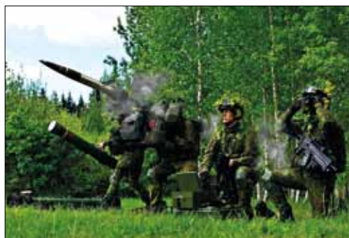
Luftvärnsrobot 70.