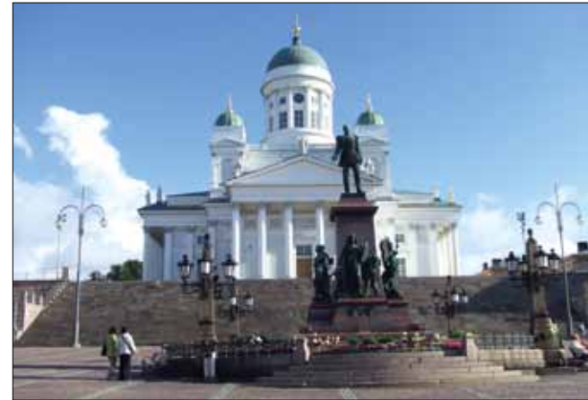
Senatstorget i Helsingfors.

Den 26 januari hade vasasenenaten utnämnt generallöjtnanten, friherre Carl Gustaf Emil Mannerheim, till överbefälhavare över de vita skyddskårerna som av Finlands senat förklarats vara regeringstrupper. Sällan har en i hast utnämnd befälhavare haft en sådan betydelse för ett lands historia. Den röda sidan erhöll visst stöd av bolsjevikregeringen i Petrograd och de i Finland garnisonerade trupperna, vilket föranledde Mannerheim att redan den 27 januari ge order om avvapning av de ryska förbanden i Österbotten.