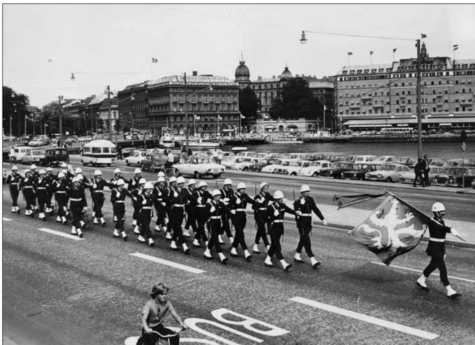
Hallands regementes högvaktsstyrka på marsch mot slottet.

”Torsdagen den 10 augusti 1972 blir en märkesdag i Hallands regementes historia. Klockan 11.30 på torsdagen ställde nämligen en trupp från I 16 upp på Sergels torg i Stockholm för att med fana i täten marschera längs Hamngatan och Kungsträdgården mot Kungliga slottet. Under dagarna fram till lördag kväll kommer I 16 att ansvara för vakthållningen på slottet, och det är första gången som Hallandsregementet fått detta högvaktsuppdrag.”