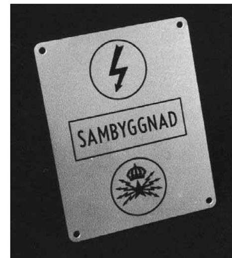
Såg skylten, men reflekterade inte närmare över konsekvenserna...

Det sista sagt dels därför att gruppchefens ansiktsuttryck ”syntes kräva det”, dels mot bättre vetande. Jag kände visserligen till var AT-stationen befann sig, men jag hade varken haft tid eller anledning att rekognoscera den; den uppgiften skulle KA 4:s personal ha löst.