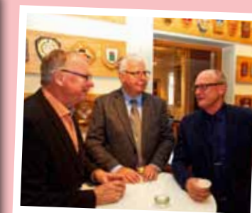
Mingel på fjärde våningen före julbordet.