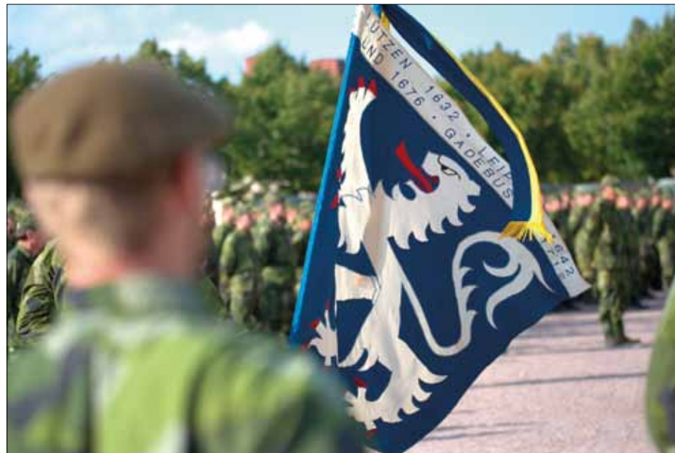
Hemvärnsbataljonen uppställd på kaserngården. Regimentets fana i förgrunden.

2013 började mina tankar på att vara en i gänget igen, och det var idrotten som sammanförde mig med hemvärdet. Jag hade under flera år under min aktiva karriär som officer tränat och tävlat nationellt och internationellt i militär femkamp, som för mig är den optimala fysiska träningen för en soldat. Den fysiska