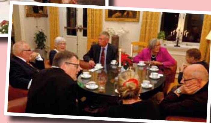
Avslutning med kaffe och trevligt sällskap.