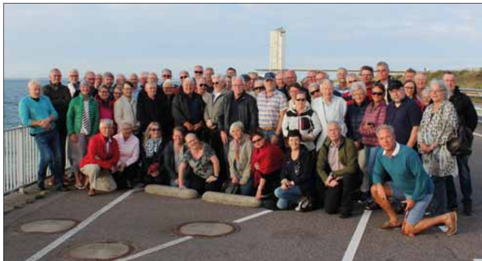
Deltagarna samlade på ”Afsluitdijk”.

Fredagen 16 september inleddes efter frukost med buss kl 08.00 in till Arnheim. Vädret hade klarnat. Det blev studiebesök vid Opera-