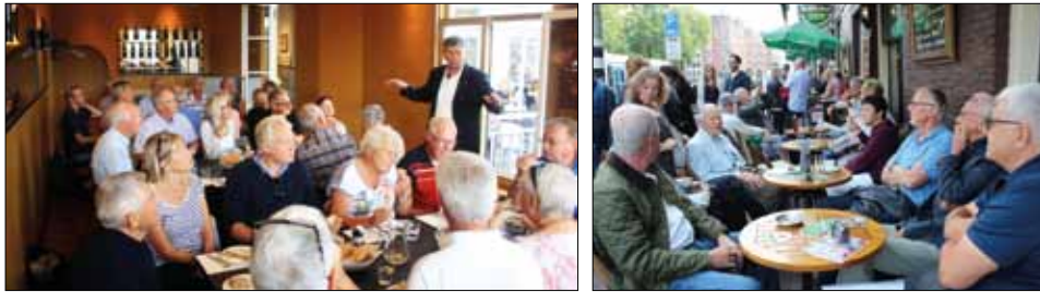
Gemytliga bilder från Hollandsresan i september 2016.