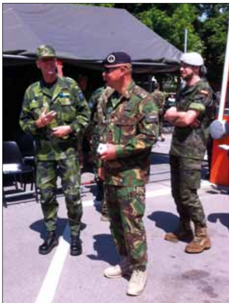
EU-dagen i Sarajevo med artikelförfattaren till vänster.

I slutet av kriget i Bosnien stred bosniaker och kroater sida vid sida mot serberna som då