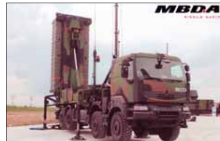
System Aster från franskitalienska MBDA.

där plikten föreslås återinföras. Beslut om detta kommer sannolikt att tagas under tidig vår 2017.