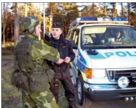
Samverkan med polisen var en del av jobbet.