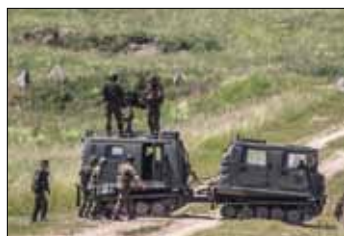
Bandvagn 206 med robot 70 på taket.

Regeringen fattade i september 2000 beslut om överföring av svensk militär materiel och fordon, i säkerhetsfrämjande syfte, till Estland, Lettland och Litauen.