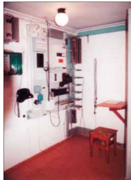
Interiör från en AT-station.

För att kunna leda försvaret av kusten beslutar gruppchefen att gruppstaben skall omgrupperas till en centralt belägen stabsplats