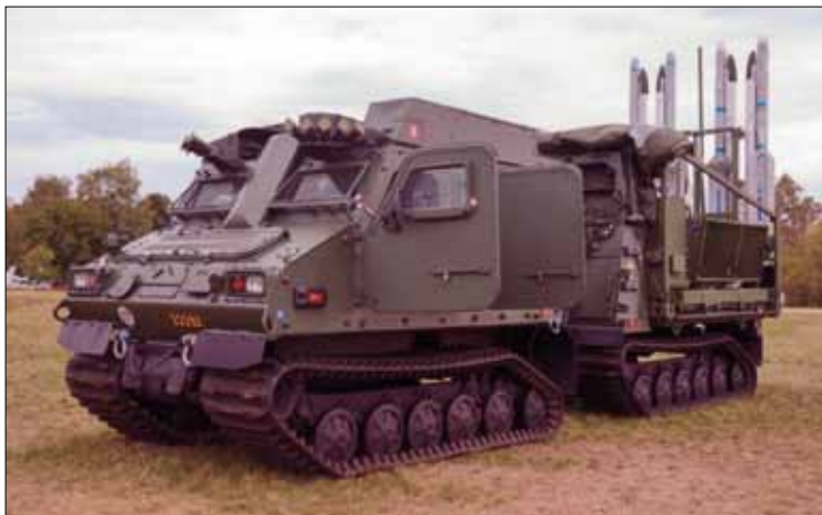
Bandvagn 410 med RB 98.