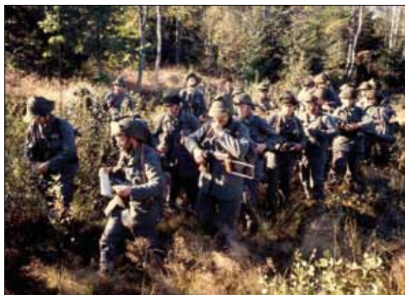
En härlig bild från dåtidens repetitionsövningar.

5-10 juni 1967: I Mellanöstern – 6-dagarkriget mellan Israel och ett antal arabstater. I Sverige – slutövning, Kungsbackagruppern. Inga direkta kopplingar, men ett tillskott av bakgrundsrealism för oss som försvarade Onsalahalvön med närliggande kustområden och inland. Samt en påminnelse om att "en order inte kan anses verkställd förrän den är kontrollerad".