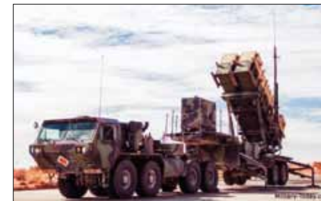
System Patriot från Raytheon (USA).

Nu är det ett annat läge. Det nationella försvaret ställer höga krav på luftförsvarsförmåga och en uppgradering av luftvärnets eldenheter är självklar. Det är beslutat om anskaffning av RB 98 (Diehl IRIS-T) med bandvagn 410 (Hägglunds) som bärare. Grundtanken var att dessa system skulle ersätta RBS 70. RB 98 finns redan som beväpning på JAS 39 Gripen och kommer att bli ett utmärkt tillskott till vår