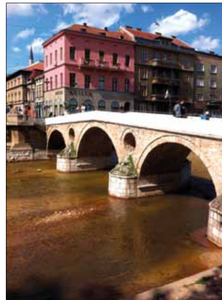
Latinbron (Latiniska ćuprija) i Sarajevo. Vid dess norra del mördades ärkehertig Franz Ferdinand av Österrike-Ungern den 28 juni 1914, en händelse som blev casus belli för första världskriget.

Jag hade bara varit i tjänst i sex veckor före denna stora konferens som jag dessutom