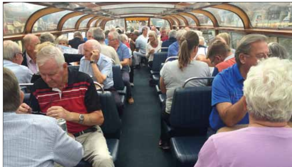
På rundtur i Amsterdam med kanalbåt.

Resan fortsatte med stopp för lunch öster om Oldenburg fram till det viktigaste obligatoriska stoppet på hemresan: Bordershop i Puttgarden.