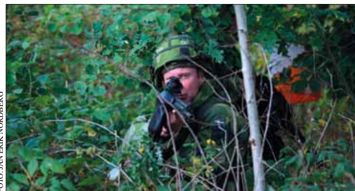
"Halt! Vem där?"