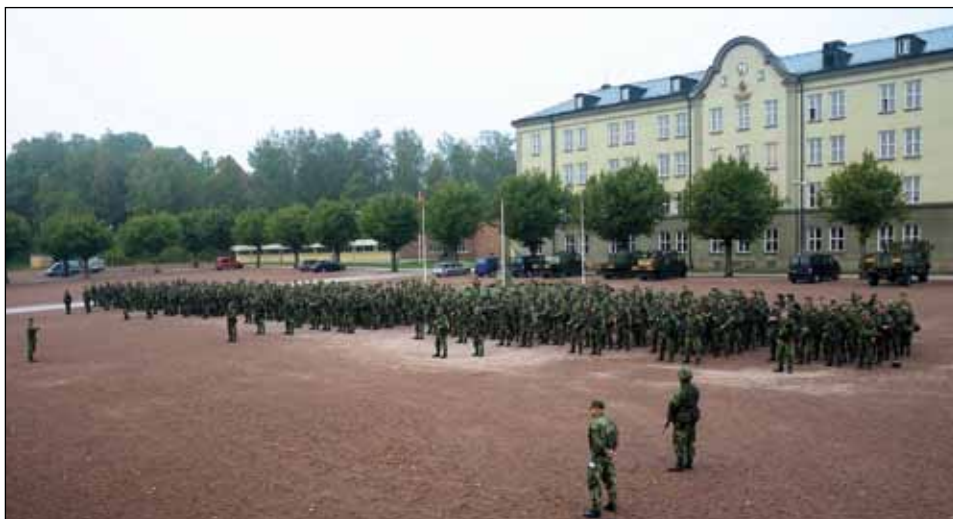
45. hemvärnsbataljonen klar för övning.

I år genomfördes befattnings-KFÖ och vi hade hela 22 olika utbildningslinjer i gång. Ett