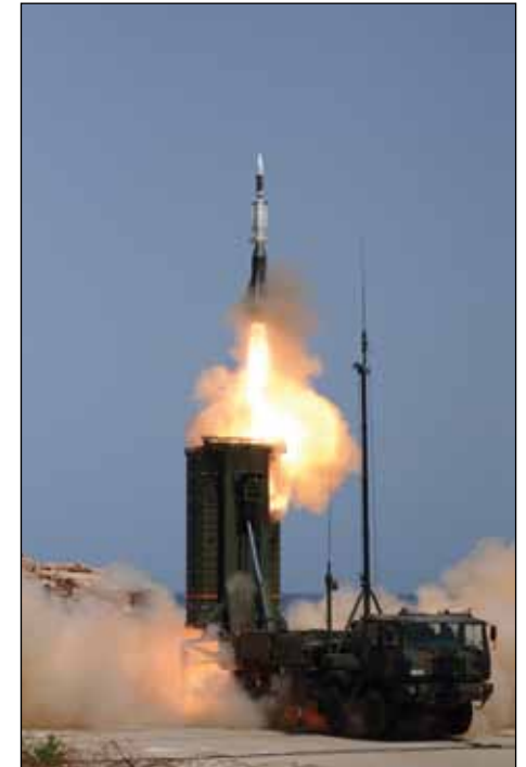
Aster, exempel på ett robotsystem med medellång räckvidd.

Vilket system som kommer att ersätta robotsystem 97 vet vi inte just nu. Det finns dock ett antal redan befintliga system som uppfyller kraven som tagits fram i samband med rapporten. Vi talar då om system som innebär en fördubblad räckvidd jämfört med robotsystem 97. En fördubblad räckvidd innebär också att yttäckningen blir ungefär fyra gånger så stor.