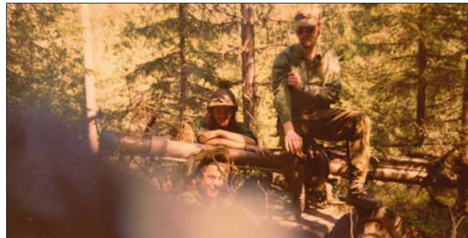
LA Karlsson vid Infanteriets stridsskola (InfSS) våren 1976.

bland annat svarade för gruppbefälsutbildningen.