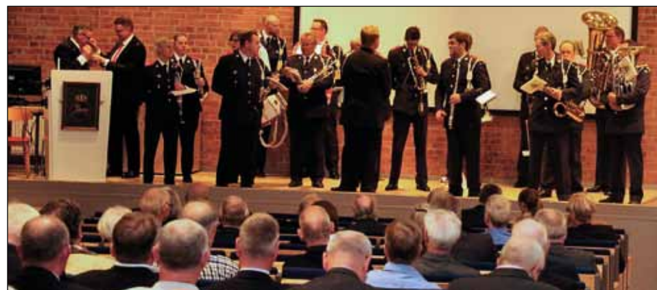
Samling till musikkårens ljuva toner.