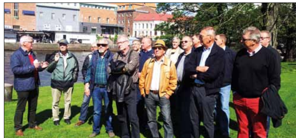
Samlingen vid Skulpturparken.