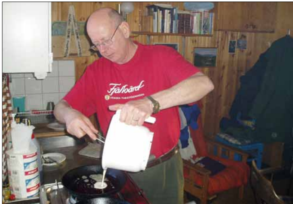
Det har blivit en hel del pannkakor på gasolspisen i fjällstugan.

I början av 1970-talet ändrades förutsättningarna för affärsverksamhet av olika slag i de mindre samhällena. Resan mot köpcentra-