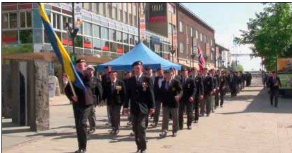
Från kamratföreningsmötet i Finland 2013.