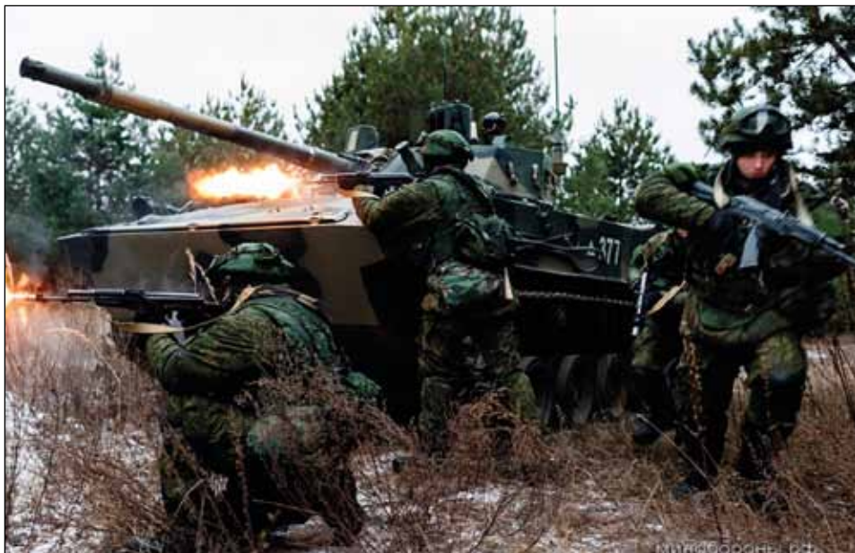
Ryska lufilandsättningsoldater med nya pansarskyttefordonet BMD-4M.

som stipulerar att ”försök att ompröva synen på Rysslands historia, landets roll och plats i världshistorien” inverkar negativt på Rysslands nationella säkerhet.