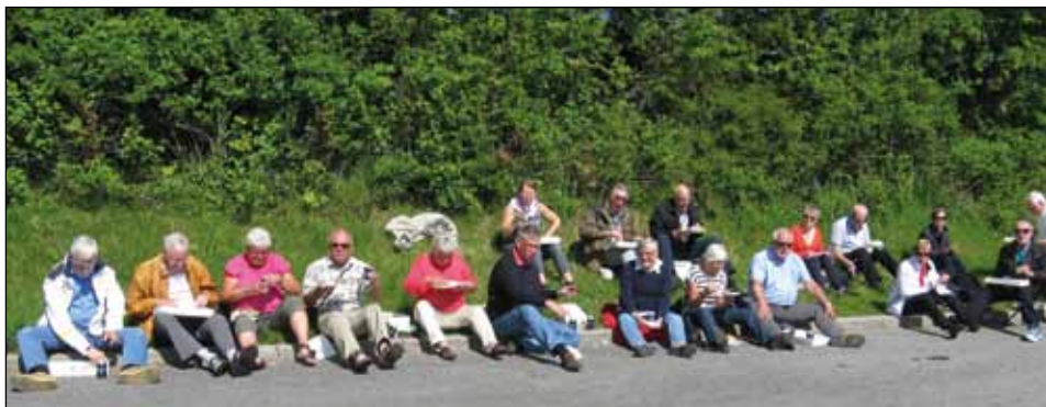
Lunch à la Jarl.

Bussresan fortsatte under information om freden i Kiel 1814 till vårt hotell Astor i Kiel. Inte långt från hotellet låg Sverigeterminalen. En stunds vila och sedan drog vi alla i väg till fots till kvällens middag i Kieler Brauerei i Gamla stan. Här intog vi förbokad mat och efterbeställd dryck. Stället såg ut som en tysk källare. Självklart smakade vi på deras hembryggda öl.