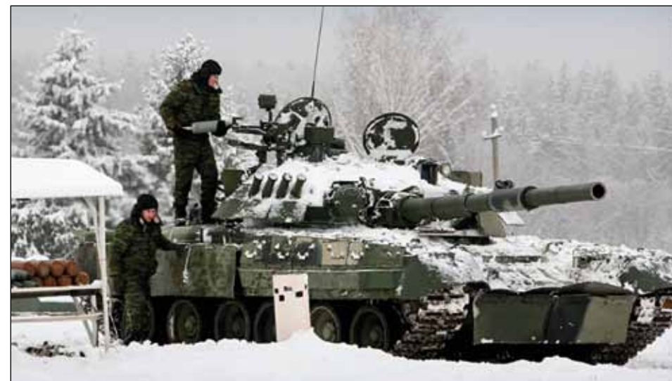
Stridsvagnsövning vid 4. Kantemirovskaja Gardes pansardivision utanför Moskva.

I den nuvarande politiska ledningens försök att stärka sin ställning, som försvagades i samband med de stora regimkritiska demonstrationerna 2011-2012, har historieskrivningen en särskilt viktig roll. Den är också en del av Rysslands nationella säkerhetsstrategi (2009),