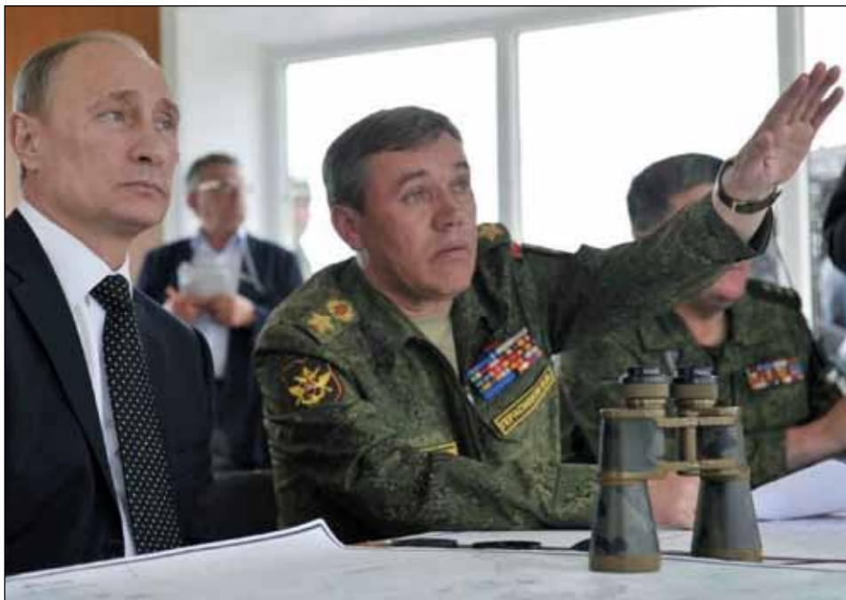
President Putin tillsammans med generalstabschefen, general Valerij Gerasimov.

För att kort recapitulera: Ryssland är i krig,