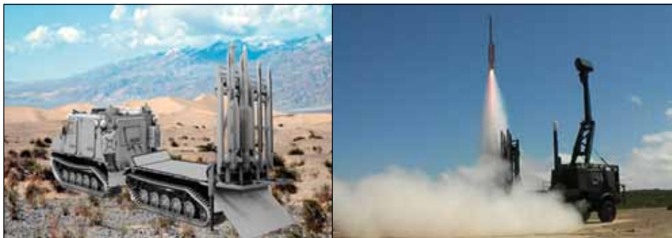
Robotsystem 98, luftvärnssystem med kort räckvidd. Bandvagnsburet respektive hjulburet.

Första steget är att införa robotsystem 98 där nu beslut om anskaffning är taget. Materielen levereras inom ett par år. Här förbättras förmågan avsevärt eftersom både höjdtäckning och räckvidd är avsevärt bättre än robotsystem 70.