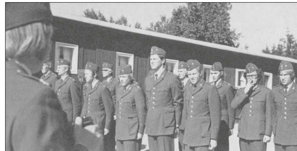
Permissionsuppställning 1970 utanför en Landalabarack.