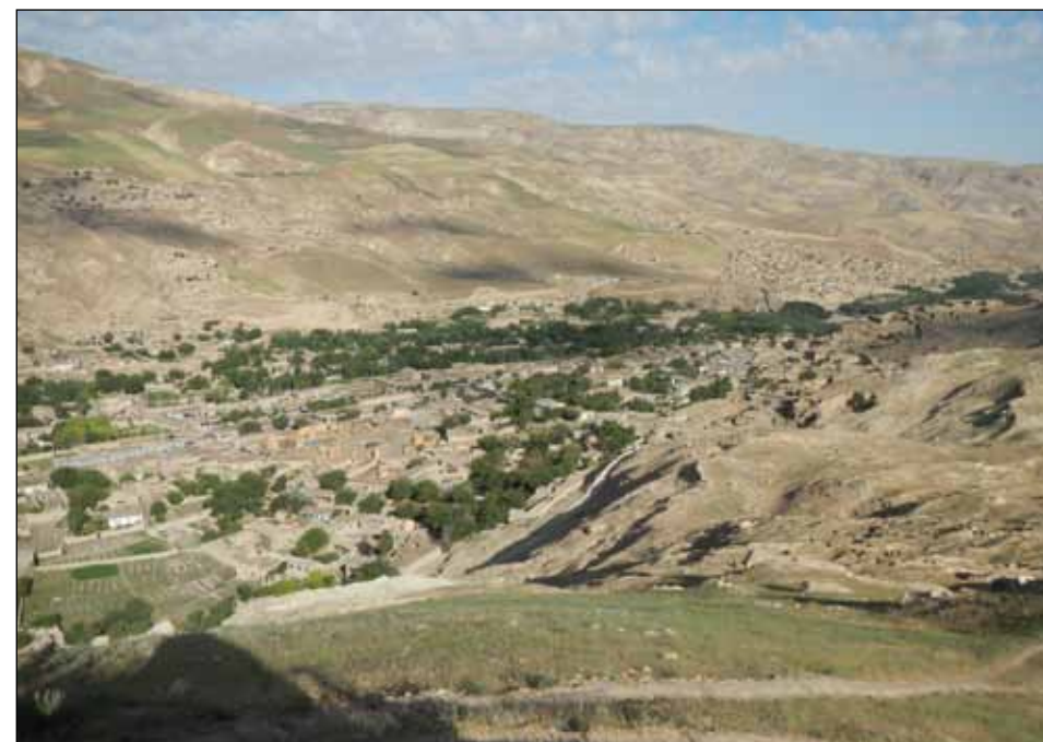
Darزاب, en kompanigruppering.

Detta var välbehövliga och bra förberedelser inför utbildningen på Livgardet. Under den här övnings- och träningsperioden fick vi utmärkt stöd av Lv 6.