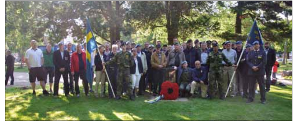
Deltagarna samlade vid minnesstenen i Norre Katts park.