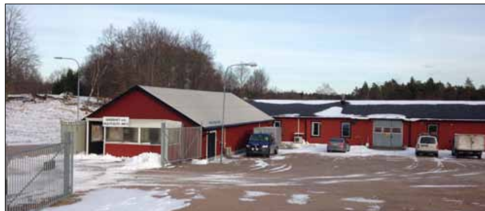
Skjutfältsexpeditionen Mästocka.