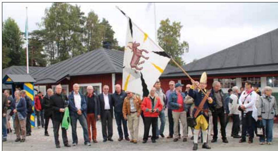
Huvuddelen av deltagarna och lånad fanförrare samlade framför museibygnaden under regementets gamla fana.

Västra lägret. Där fanns renoverade och nybyggda byggnader, ett speciellt och intressant karolinerläger, husarernas fältstallar, Beredskapsföreningen 39-45 som visade tält, uniformer och utrustning, en historisk fordonspark, Sveriges veteranförbunds monter, fanparad som övade, en kanonservis likaså, Smålands husarer som mjukade upp hästarna, VIP-gäster som anlände och hemvärnsmusik-