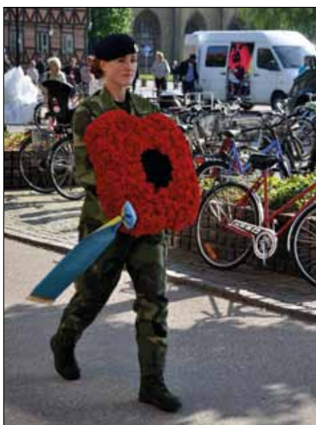
Röda nejlikor i form av en vallmokrans.

Den tredje tisdagen kl 18.00 i varje månad träffas veteraner och anhöriga på Soldathemmet.