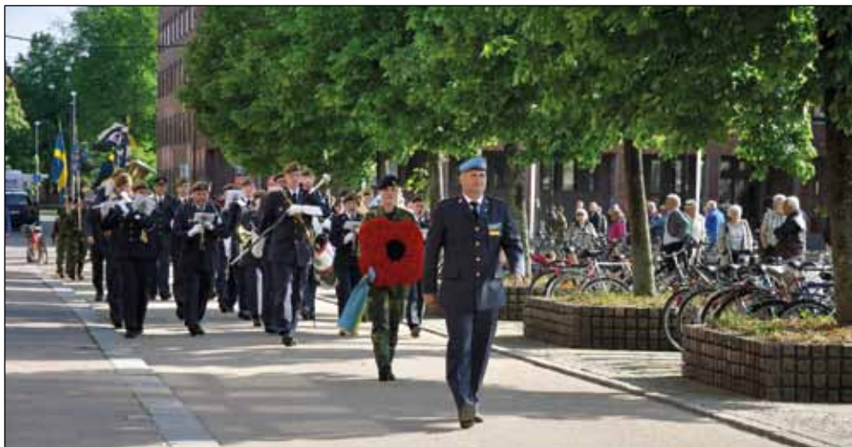
Paraden genom Halmstads innerstad passerar Stora Torg.