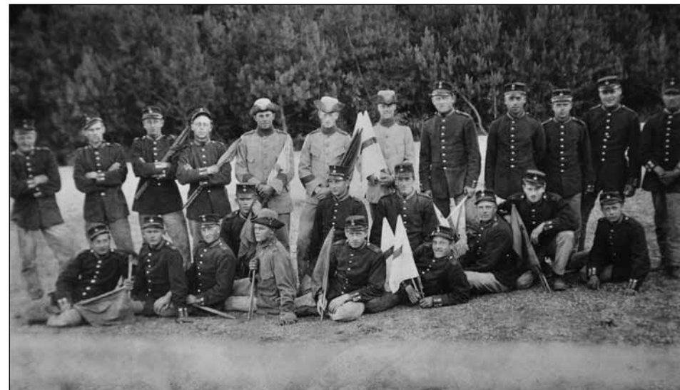
Exempel på "privattaget" vykort. Signalpluton omkring 1915. Observera uniformsblandningen, typisk för tiden, och signalflaggorna, den tidens "radio".