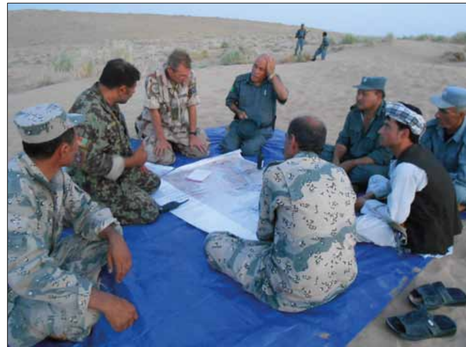
Handledning av stridsledaren under operation.

Varje kompani var tilldelat ett mentors-team likväl som stabens olika sektioner och befattningshavare. Ett kompanimentorsteam var organiserat med en huvudmentor som i huvudsak var rådgivare åt kompanichefen. I teamet tjänstgjorde också en eller två NCO