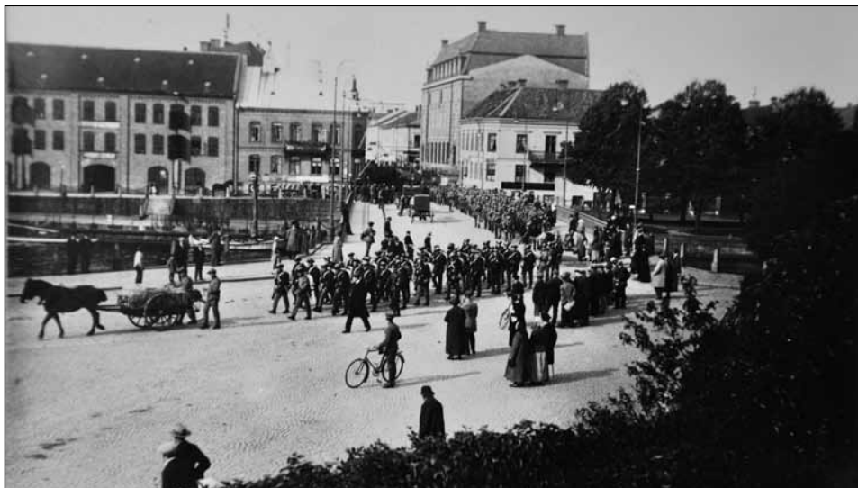
Regementet på marsch mot Skottorp för att ingå i nordarmén under den stora fälttjänstövningen i södra Halland 1923. Kortet kan dateras exakt: 25 september 1923 på förmiddagen, omkring kl 10.00. Vykort.