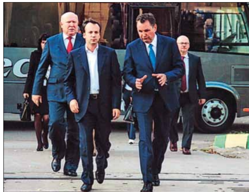
Besök i verksamheten är mycket viktiga.