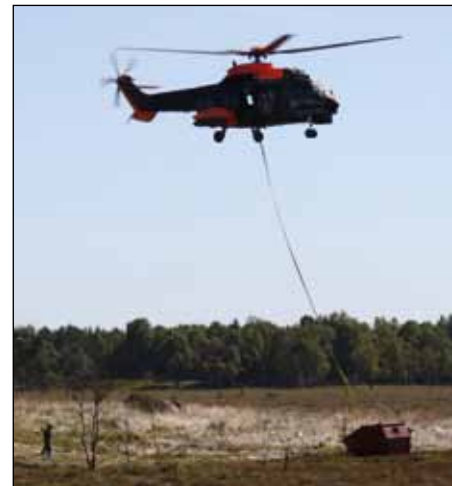
Helikopterlyft av 40 mm gevärsgrenatbana.

Dessutom utvecklar vi fältet. Rälsmålbanan utvecklades 2013 med nya skjutplatser, nytt drivpaket och målanordning som numera styrs trådlöst. En bana för att skjuta 40 mm gevärsgrenat med skarp stridsdel är iordningställd på "målet". Det löstes i samverkan med helikoppterenheten i Ronneby.