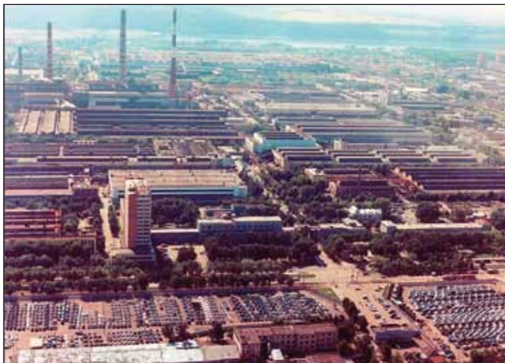
GAZ fabriksområde i Nizjni Novgorod.